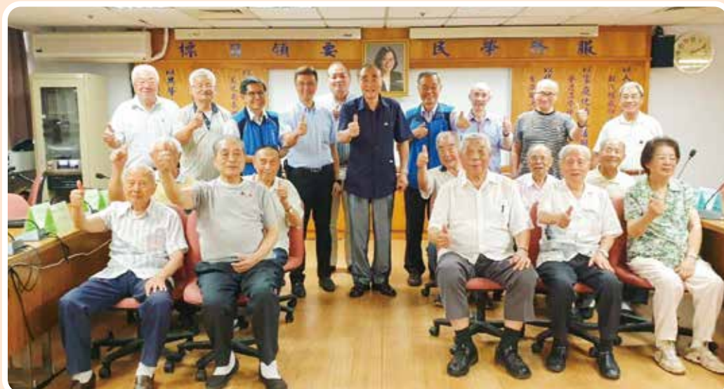
↑八德榮家獲得住民們的好評。