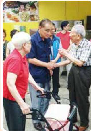
↑大家都說：「伙食辦得好。」