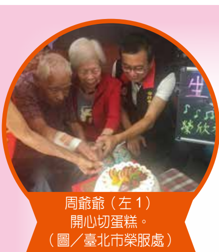
周爺爺(左) 開心切蛋糕。