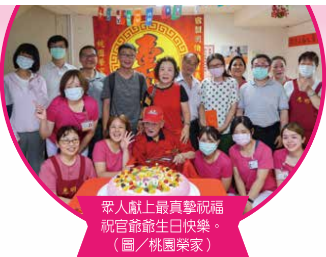
眾人獻上最真摯祝福 祝官爺生日快樂。