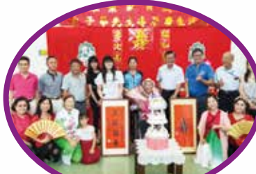
左爺爺(中)的 壽宴有60人來慶祝。