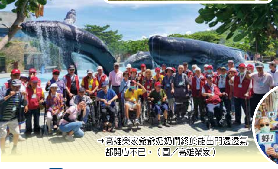
→高雄榮家爺爺奶奶們終於能出門透氣都開心不已。

長輩輕鬆自強知性之旅 【本刊訊】為紓解疫情期間情緒壓力，臺南榮家與高雄、屏東榮家日前分別舉辦自強活動微旅行，臺南榮家安排住民長輩參訪花蓮榮家及馬蘭榮家，與住民實施聯誼交流活動。高雄榮家成立了「八千歲」旅遊團，至臺灣東海岸一日遊。屏東榮家則安排長輩們到海洋生物博物館，藉著在館內