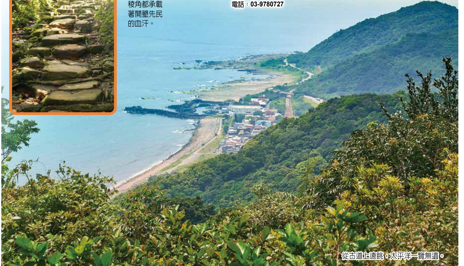
從古道上遠眺，太平洋一覽無遺。