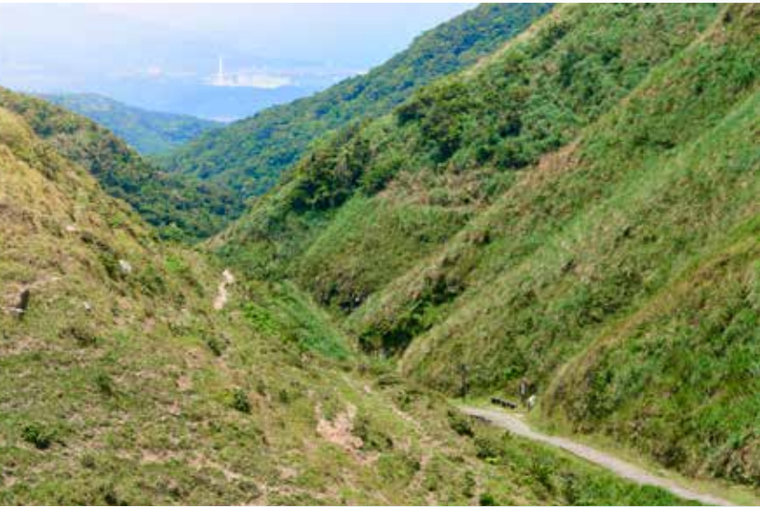
↑草嶺古道橫跨新北市與宜蘭縣，此面向遠眺為新北市貢寮區。

古道大里入口處位於大里遊客服務中心旁，大里遊客服務中心內展示草嶺古道的人文史蹟，並設有東北角旅遊區域及宜蘭地區的旅遊資訊，服務中心也設有展示館，另有一間多媒體放映中心，從早上十點至下午四點間，每逢整點就會播放「草嶺古道」及「快意自在悠遊東北角」的節目供遊客觀賞；此外，一樓大廳北側旁廣場設有仿虎字碑的拓碑區，設有虎字碑的複製品，並載明拓印正確方法，讓遊客親身體驗拓碑的樂趣。