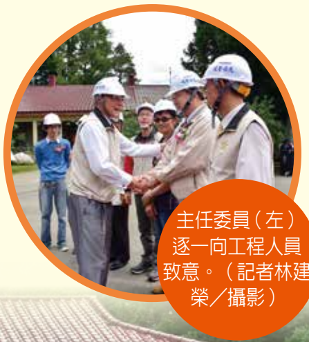
主任委員（左）逐一向工程人員致意。

此外，主任委員也慰勉捍衛臺灣領空安全、維護國人福祉的飛行軍官，以及漢翔公司自力研發國造高教機首飛成功，這種熱愛臺灣這塊土地與推動全民國防精神所付出的辛勞，特別表達推崇與肯定之意。同時，也竭誠歡迎國軍飛行軍官及漢翔同仁於休假期間，至輔導會農場住宿旅遊，輔導會將提供專屬的折扣優惠。最後，主任委員呼籲愛好親近山林的遊客，將自身垃圾帶下山，共同維護臺灣的好山好水。