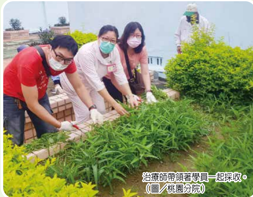
治療師帶領學員一起採收。（圖／桃園分院）

↑課程之一是戴上特製鏡片、耳機及手戴沙包模擬高齡長者因視力退化、聽力退化及手指運動退化下，夾食物的困難。（圖／埔里分院）