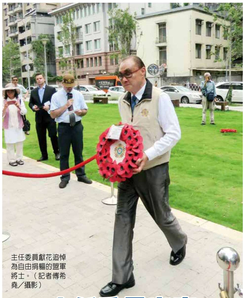
主任委員獻花追悼為自由捐軀的盟軍將士。