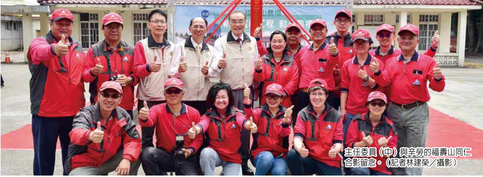
主任委員（中）與辛勞的福壽山同仁合影留念。