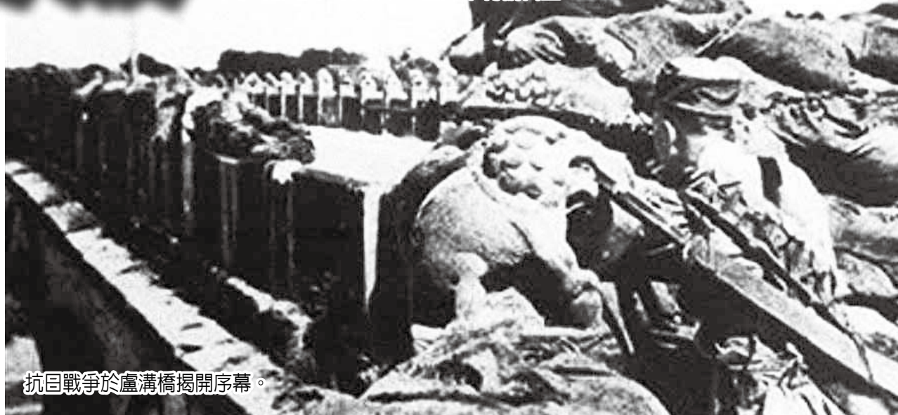
抗日戰爭於盧溝橋揭開序幕。