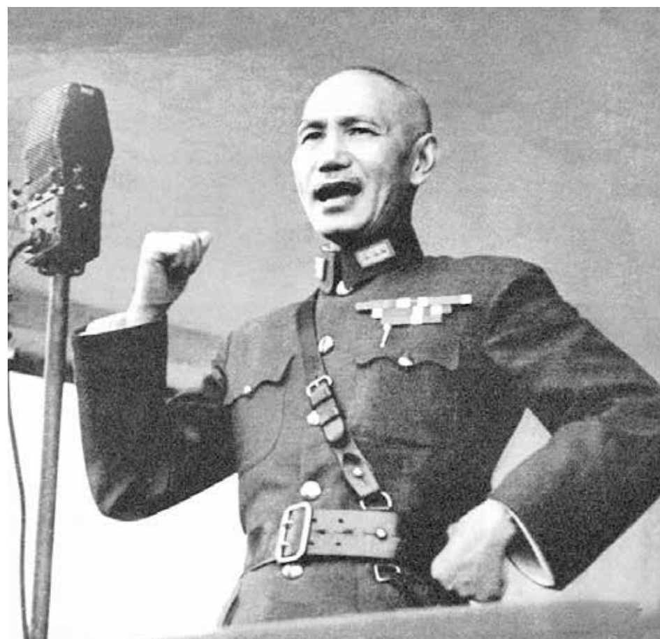
蔣中正委員長於廬山發表談話，展現不畏戰的決心。