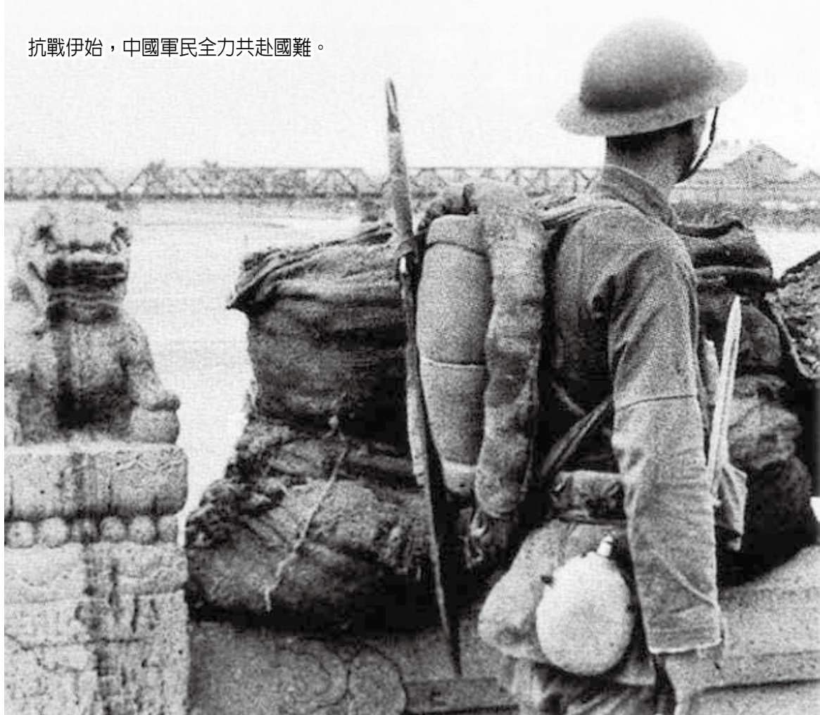
→奮勇率兵對抗日軍的吉星文將軍。