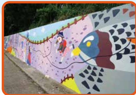
↑通往鐵砧山必經的成功路披上彩繪。