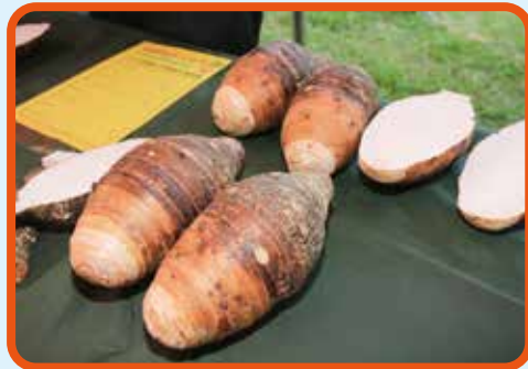
↑大甲芋頭口感、香味及Q度佳。