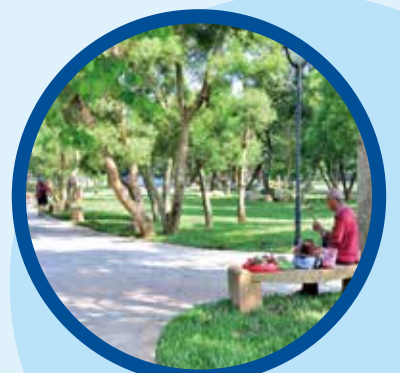
鐵砧山風景特定區