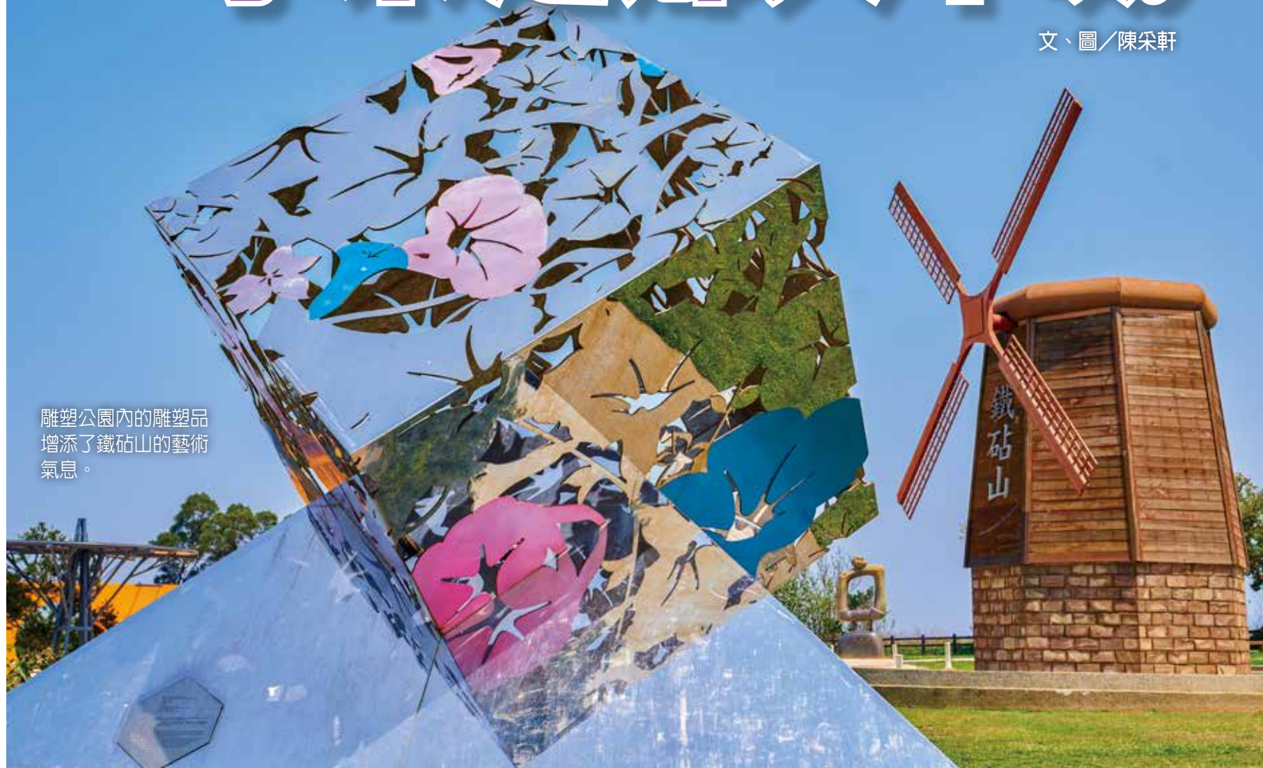
雕塑公園內的雕塑品增添了鐵砧山的藝術氣息。

大甲是臺灣十大觀光小城之一；其中大甲鎮瀾宮更具盛名，每年農曆三月的媽祖遶境活動廣為人知，不僅名列世界三大宗教活動之一，也因此帶動大甲區的名氣與觀光；而除了媽祖之外，這座以扇狀平原地形為主的小鎮，更有著許多山海間才看的美景。