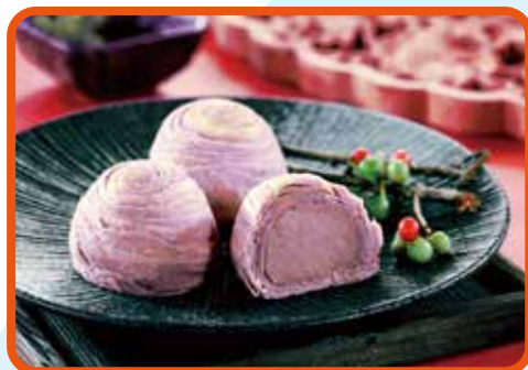
↑以大甲芋頭研發的食品相當受歡迎。