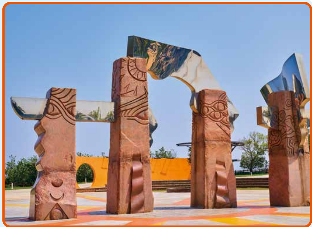
↑雕塑公園入口的「太陽之門」。劍井歷經歲月的洗鍊，擁有當地居民口耳相傳的傳奇故事。

在行經鐵砧山步道的途中便會經過雕塑公園，雕塑公園於去年全新落成，園區內放置了十件雕塑品，增添了鐵砧山的藝術氣息。雕塑公園是大甲區積極發展的重點觀光項目之一，溯自民國八十五年，