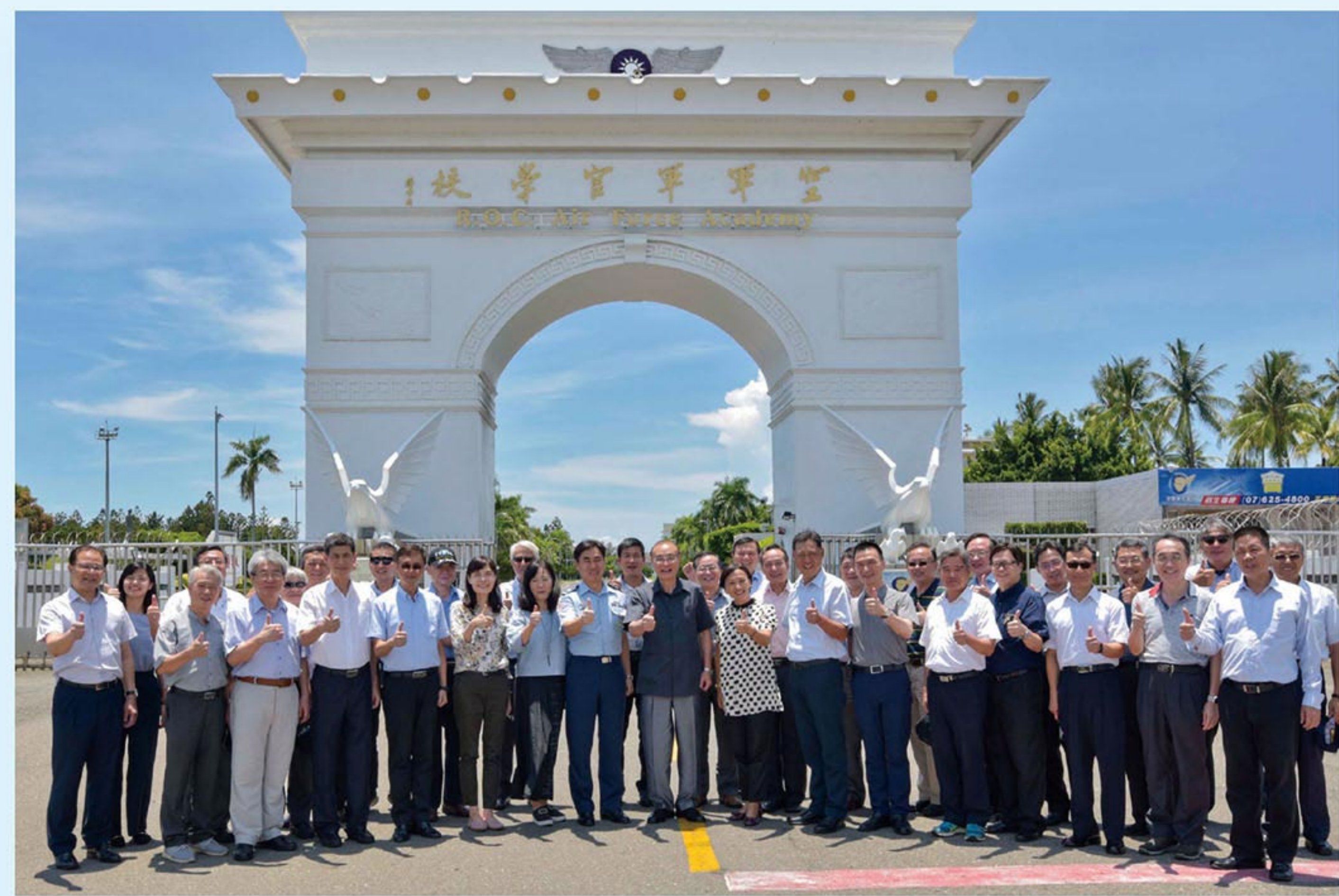
↑參訪結束後，大家於空軍官校大門前合影留念。

【本刊訊】主任委員馮世寬日前率員參訪空軍官校及空軍臺南基地。主任委員表示，此次率領輔導會一級幹部參訪國軍重要單位，希望能了解我國國防，以實際行動落實全民國防理念，共同為國家安全盡一己之力。 主任委員一行分別參觀空軍官校航校、飛行模擬教室，對於空軍官校在各項設施的建置成果表示敬重。空軍官校表示，將持續戮力戰訓、培育優秀飛行人才，落實全民國防教育，不負國人期許。 主任委員參訪臺南空軍基地，實際了解聯隊官兵平時執行戰備任務的辛勞，對於官兵們平日盡忠職守、肩負保家衛國的重責大任，致上最高的敬意，也期許國人不分老幼響應政府推展全民國防教育的政策。