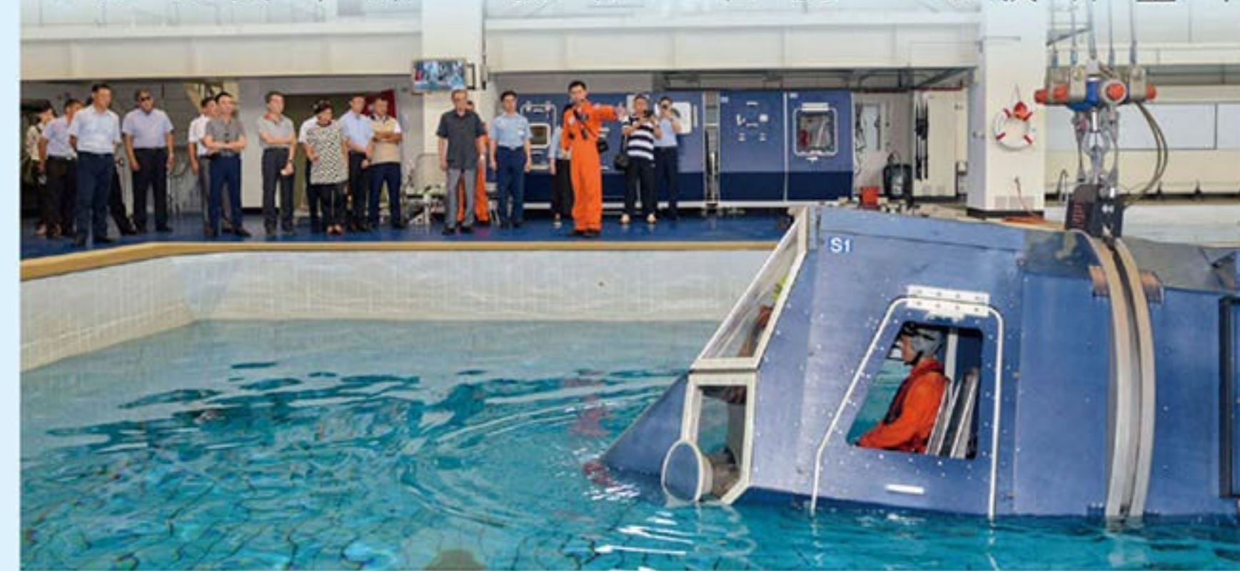
↑輔導會參觀空軍官校求生訓練中心。

【本刊訊】主任委員馮世寬日前率員參訪空軍官校及空軍臺南基地。主任委員表示，此次率領輔導會一級幹部參訪國軍重要單位，希望能了解我國國防，以實際行動落實全民國防理念，共同為國家安全盡一己之力。 主任委員一行分別參觀空軍官校航校、飛行模擬教室，對於空軍官校在各項設施的建置成果表示敬重。空軍官校表示，將持續戮力戰訓、培育優秀飛行人才，落實全民國防教育，不負國人期許。 主任委員參訪臺南空軍基地，實際了解聯隊官兵平時執行戰備任務的辛勞，對於官兵們平日盡忠職守、肩負保家衛國的重責大任，致上最高的敬意，也期許國人不分老幼響應政府推展全民國防教育的政策。