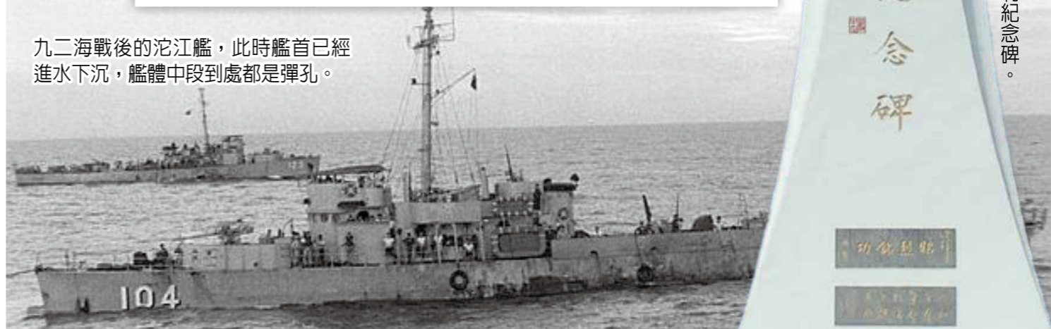
九二海戰後的沱江艦，此時艦首已經進水下沉，艦體中段到處都是彈孔。