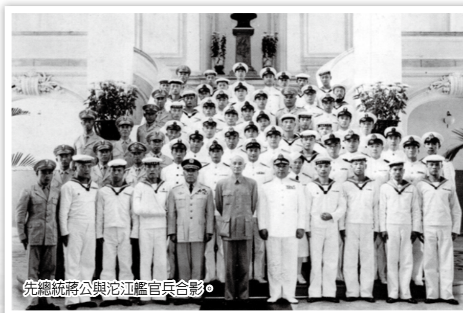
先總統蔣公與沱江艦官兵合影。