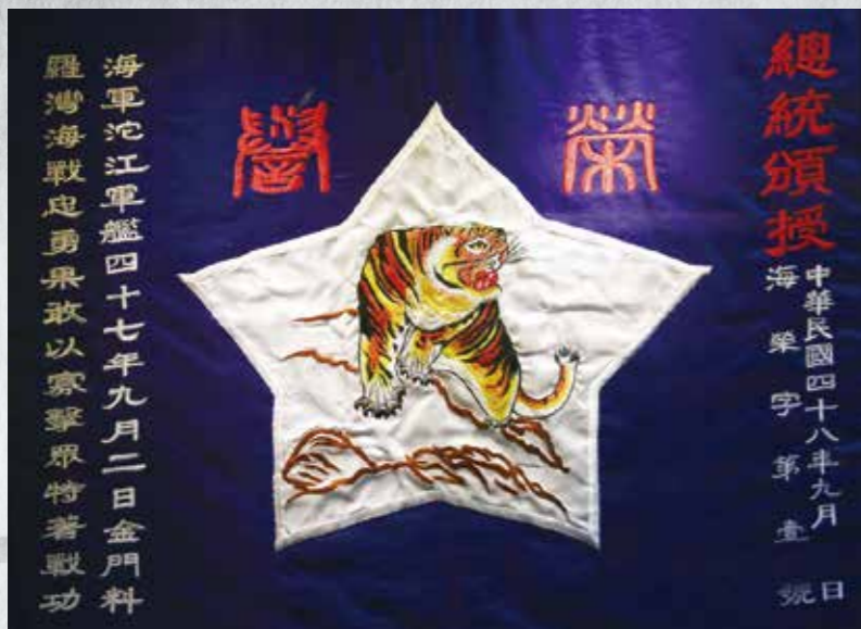
↑九二海戰勝利先總統蔣公親頒之榮譽旗。 ↓九二海戰紀念獎章。