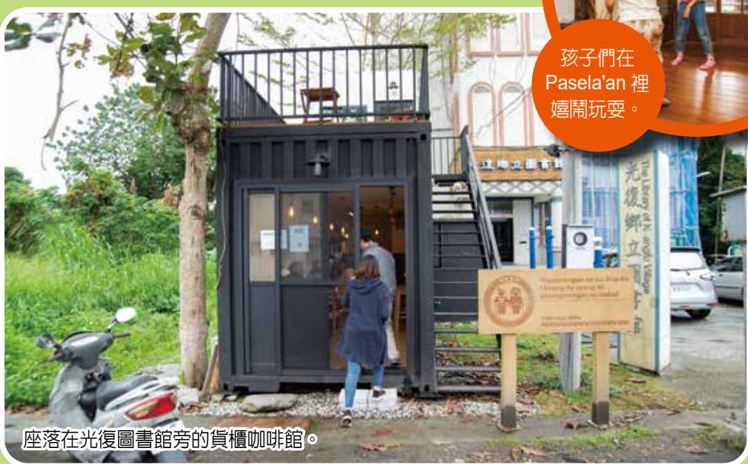
座落在光復圖書館旁的貨櫃咖啡館。