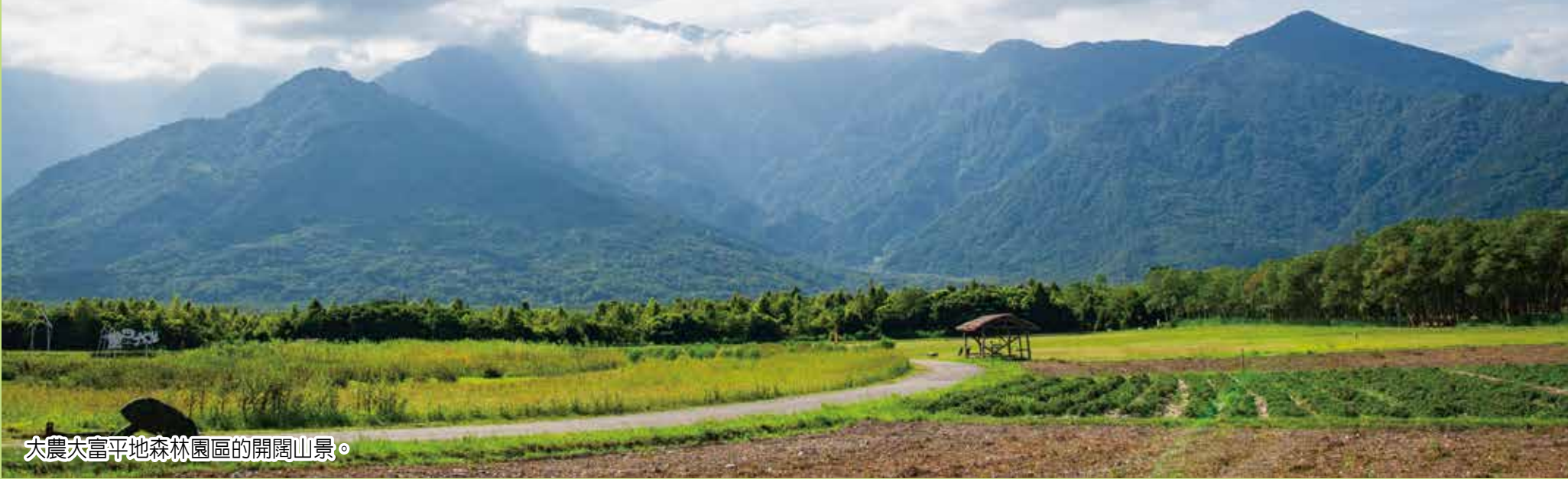
大農大富平地森林園區的開闊山景。