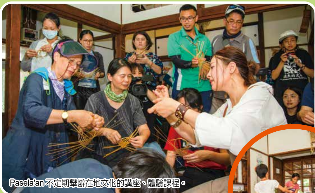
Pasela'an 不定期舉辦在地文化的講座、體驗課程。