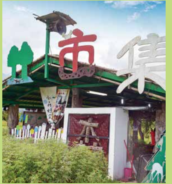
↑大農大富的森林市集。