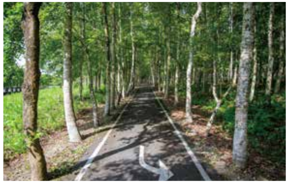
↑大農大富園區裡充滿綠意的自行車道。