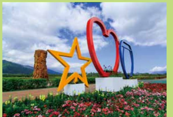
↑裝置藝術吸引遊客拍照打卡。