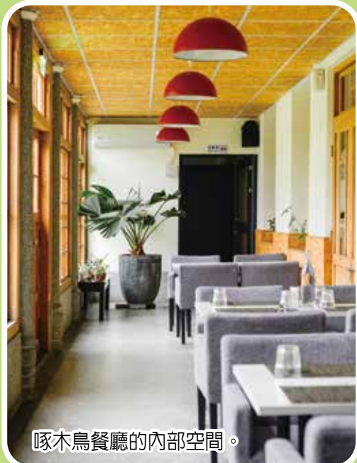
啄木鳥餐廳的內部空間。