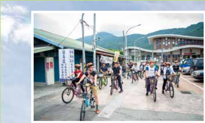
↑光復鄉十分適合單車旅遊。

服務 家歡迎符合 (眷)、遺 眾申請入住 榮家 市板橋區 段 32 號 22755157 榮家 市三峽區 127 號 26731201 榮家 市八德區 1217 號 3681140 榮家 市八德區 1100 號 3651285 榮家 市松嶺路 41 號 5213292 榮家 市桃源里 段 301 號 7222187 榮家 市田中鎮 段 421 號 8747647 榮家 市斗六市 160 號 5324100 榮家 市白河區 草 63 號 6852164 榮家 市七股區 147 號 7880664 榮家 市明路 190 號 2690418 榮家 市楠梓區 631 號 3652828 榮家 市燕巢區 路 1 號 6161214 榮家 市內埔鄉 100 號 7701621 榮家 市前路 29 號 8223111 榮家 市更生路 0 號 9222417 福田 市榮民榮眷 自贈專戶 才團法人榮 基金會 行： 庫銀行 南路分行 次帳號： -626-734 局： 劃撥帳號 -2111