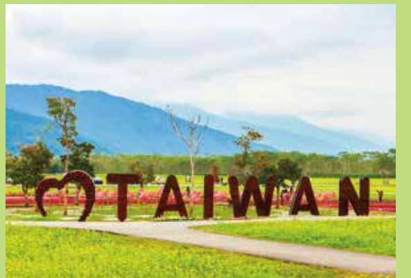
↑大農大富植物種類眾多，四季皆有花海。