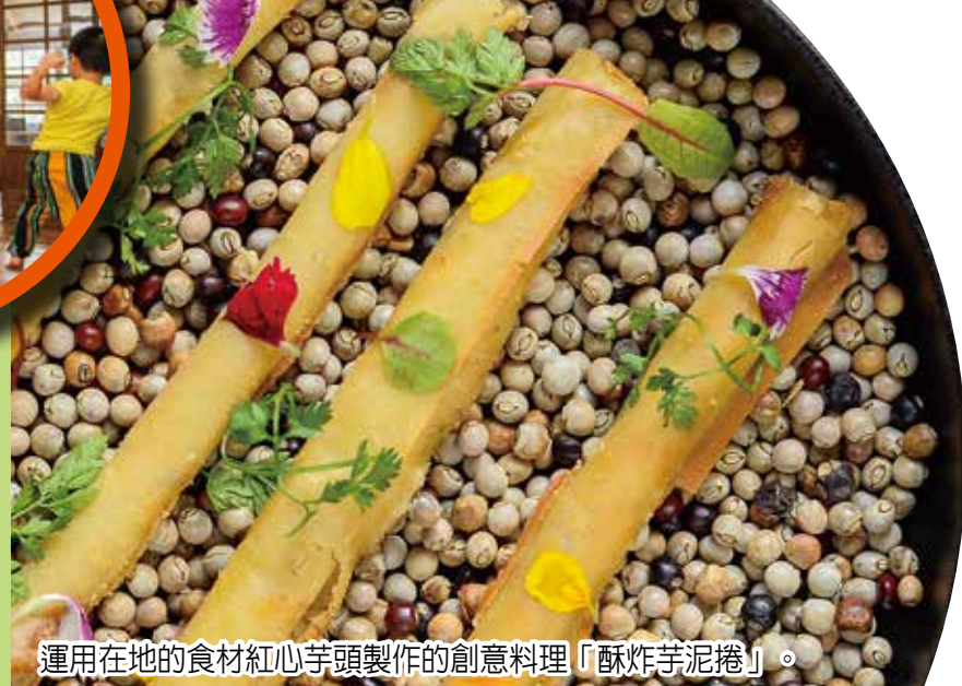
運用在地的食材紅心芋頭製作的創意料理「酥炸芋泥捲」。

平森療癒 走訪大地林域 走讀完百年木屋的故事，來到被中央山脈與海岸山脈所環抱的大農大富平地森林園區，擁有十分遼闊的場域，占地一千兩百五十公頃的森林園區（相當於四十八座大安森林公園），一望無際的林域共栽種了近二十種、百萬株的低海拔常見樹種，是全國第一座平地森林園區。園區內設有環繞的自行車道，任意散步或者騎踏車在園區內，何處都能沐浴到芬多精，享受森林療癒，體驗「森」在其中的綠意與趣味。除此之外還有複合有機稻作與田園風光的縱谷景觀、原住民文化的木雕藝品以及給予旅人拍照留念的裝置藝術。 尤其每年的秋冬時節，自行車道兩旁的杜英、楓香、青楓等樹木，逐漸由綠轉黃再變火紅，在自行車道上騎乘單車，傾聽車輪和楓葉共鳴的沙沙聲響，不用抬頭便能欣賞絢麗楓林。近期於今年十月十一日在園區內還有《M：我們的大農大富平地森林情境裝置展》，邀請音樂人們在園區設錄了四個聲音裝置，分別是《野林慶宴》、《Forest》、《集悅》、《森林慶典豐盛之舞》，也歡迎所有遊客來此體驗林間的聲音饗宴。 美味力量 在地軟實力 到東部旅遊，許多人會停佇在光復糖廠，吃個冰休息便前往下個景點，然而在糖廠卻有個隱藏在後方的義式餐廳「啄木鳥的家」，時常被旅人所遺漏。啄木鳥餐廳是由公益團體「啄木鳥全人發展協會」所創立，主要為提供在地青年就業的公益餐廳平臺，定期將盈餘三十%回饋在地。