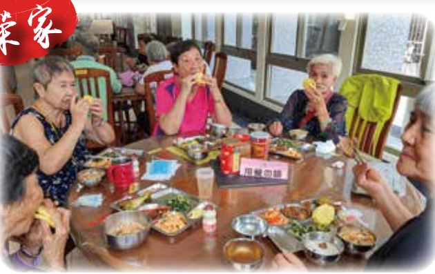
↑彰化榮家長輩們開心大啖烤腿排刈包。 ↑臺灣豫劇團特別為高雄榮家長輩演出全新劇碼，歡慶中秋。