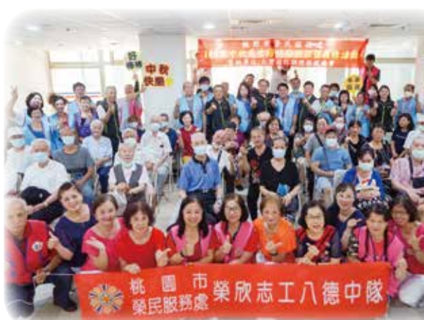
↑桃園市榮服處以養生義診與榮民前輩們歡度佳節。 →基隆市榮服處贈送榮民（眷）中秋月餅等，歡度佳節。