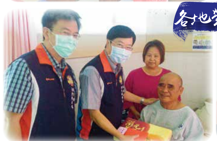
↑南投縣榮服處於佳節探視榮院榮民。