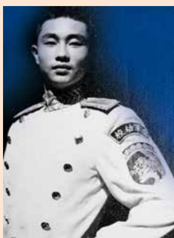
↑當時參加國慶閱兵時還被選為模特兒。

時間過得好快，才過完九二軍人節馬上就是我們中華民國十月十日的國慶日了，這是慶祝辛亥年十月十日武昌起義成功的紀念日，也稱辛亥革命紀念日，現在我們都簡稱雙十國慶或雙十節。民國五十年我已是幼校二年級了，每個參加閱兵的同學幾乎都晒的鼻子脫皮，但每個人都能參加國慶閱兵為榮，沒人計較一整個暑假訓練南部的艱陽都在踢正步，當時還有空軍官校、通校、機校一起集訓，聽說長官來校閱時要選最好的去參加。我們踢破了好幾雙軍用黑膠鞋，當時的軍鞋工藝，裡面只有一層薄墊，根本就是腳板打在幼校水上機場的水泥塊上，腳底都起了水泡！當時不知從哪來的這股精神，力拚去參加國慶閱兵！