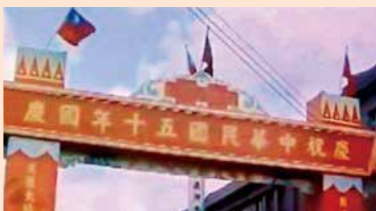
↑民國50年國慶日的慶祝牌樓。

大鵬站等北上的火車。我們坐了一班「溫良恭儉讓」的班車，它逢站必停，無站也停，讓各種車先行，到第二天十月一日凌晨才到臺北，坐這麼久的車，同學們都興高采烈、滿心歡喜。我和另一位同學負責看守行李，規定學生是不可以抽菸的，那些老菸槍都溜到我們行李專車來，頓時這節車廂變成了「工業區」，我也加入哈了它兩口！ 到了臺北才有國慶閱兵的氣氛，首先套量的新閱兵服做好了，全身白色、白帽子、白腰帶、白皮鞋、白襪子、領章及佩件都是金色，臂章是深藍色，搭配的亮麗，我還被選去當模特兒，我當部長時媒體公布了這張照片，以前我自己都沒有。接著有二次大約是晚間九點至十一點的夜間預習，加上等長官訓示，回到駐地已是凌晨，當天傍晚七點多我們就站在衡陽路上了，晚上看閱兵的人潮真是人山人海，我們都聽到了許多讚嘆聲，害我們在隊伍裡，一動也不敢動，一個方隊就像一塊鐵錘，整個過程沒人喊累，可見士氣高昂是多麼的重要！