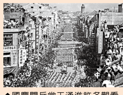
↑國慶閱兵當天湧進許多觀看閱兵的人潮。