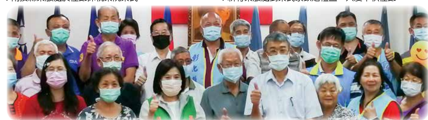
↑彰化縣榮服處辦理「卦山榮情，長榮送愛」中秋節關懷榮民（眷）活動，邀請長輩同樂。