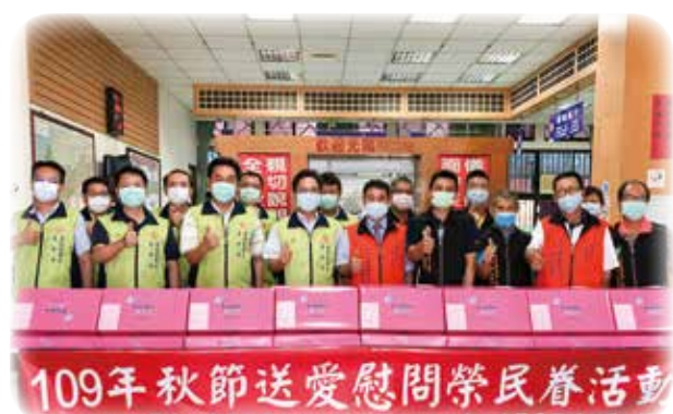
↑臺中市榮服處連結社會資源，探視榮民（眷），致贈慰問品祝福中秋佳節愉快。 →臺北市榮服處到單身退舍發放愛心物資，歡慶中秋。