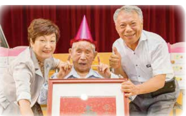
↑花蓮榮家於中秋佳節舉辦聯歡及百歲人瑞住民慶生活動。