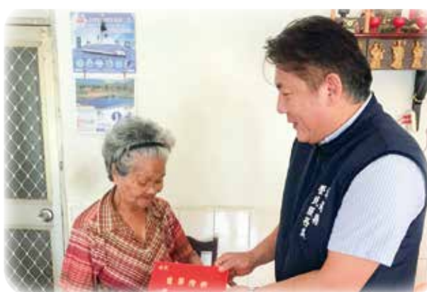
↑澎湖縣榮服處至榮民（眷）家中致贈秋節慰問金。

時全身都汗濕了，最難忘的一次預習是在雨中按計畫預校，等長官訓示完，天都快亮了，回到駐地雨水加水，滿身濕透的喝著熱呼呼的薑糖水，真溫暖了我們的心！ 國慶閱兵當天，一早就起床了，用餐、著裝，七點不到就站在衡陽路上備便了，那麼早看閱兵的人潮就讓我擠出去上厕所，差點擠不回來。好多人擠在我們隊伍旁邊拍照，給我們比大姆指說讚，一定是那一身新穎的閱兵服吸引了群眾，當軍樂聲響起，我們熱熱的隨音樂節奏，全力以赴的通過了閱兵臺，因為精神完全集中在向右標齊、向前對正，緊張的閱兵臺上什麼都沒看見，等集合好，聽訓時才隱約看到了老總統，他那曾指導過我們抗日、剿匪到臺海戰役，令人熟悉的寧波腔國語，如今只待成追憶了！ 回想起五十九年前的第一次參加國慶閱兵，能忝為受閱部隊的一份子，至今回味無窮、將永生難忘！