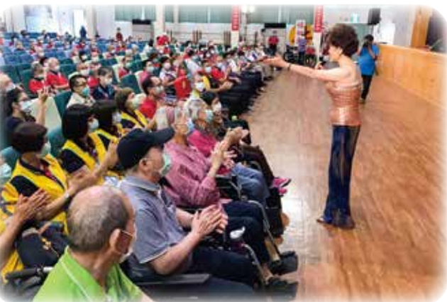
↑中視愛心基金會到中彰榮家與榮民同樂歡慶佳節。