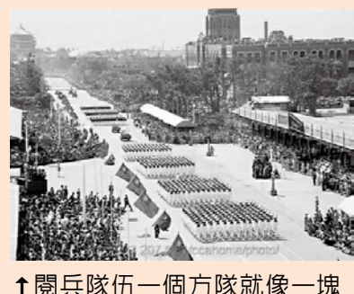
↑閱兵隊伍一個方隊就像一塊鋼鐵，士氣高昂。