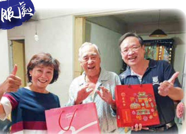
↑新竹榮服處到榮民家致贈禮盒，共度中秋佳節。