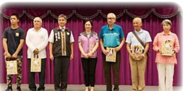
↑臺東縣榮服處在中秋之際致贈月餅禮盒，並由臺東縣多元移民關懷協會提供舞蹈表演。