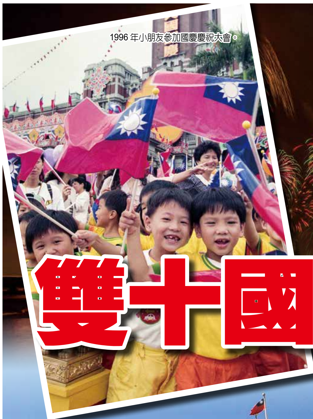
1996 年小朋友參加國慶慶祝大會。