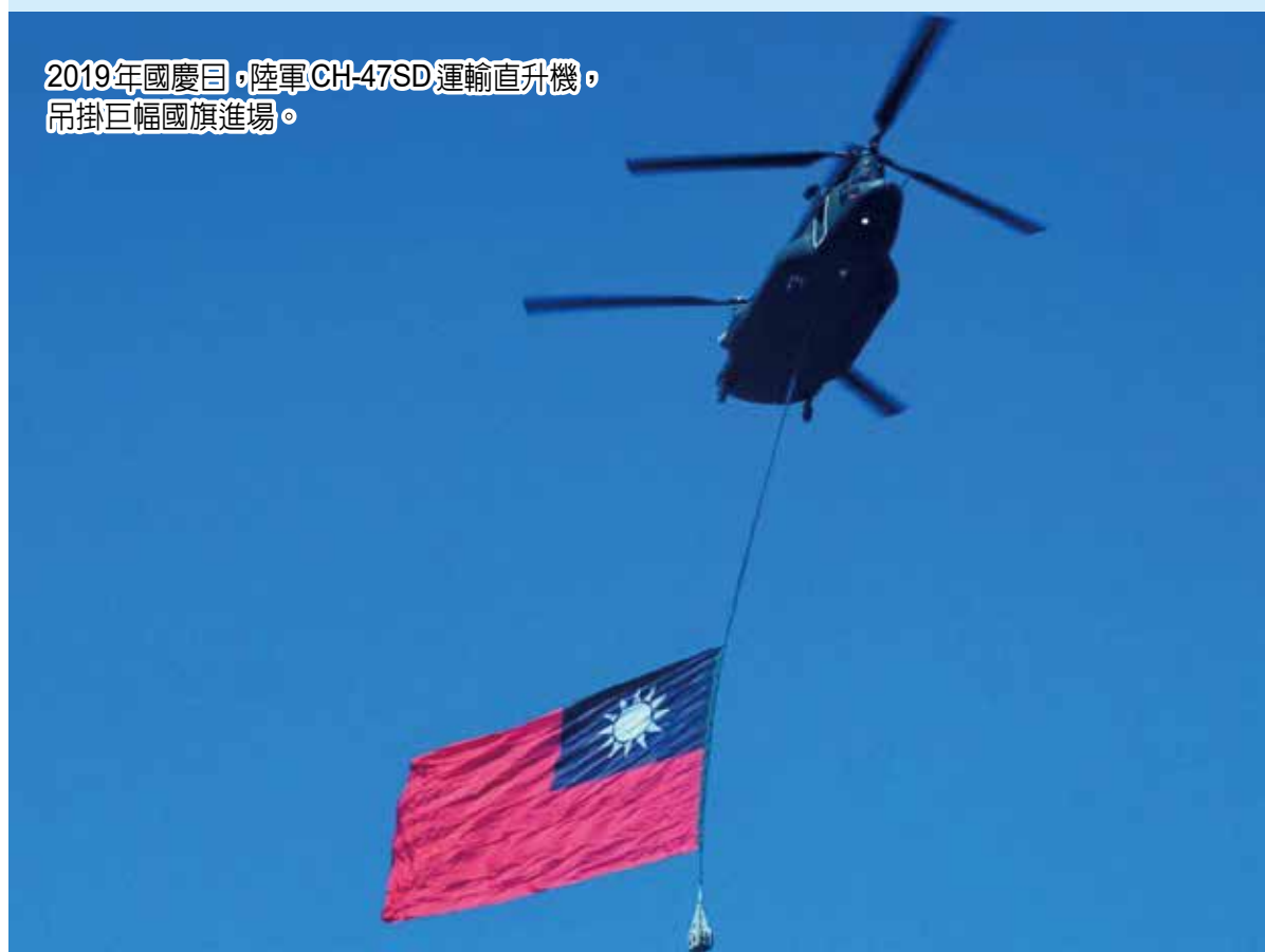
2019 年國慶日，陸軍 CH-47SD 運輸直升機，吊掛巨幅國旗進場。