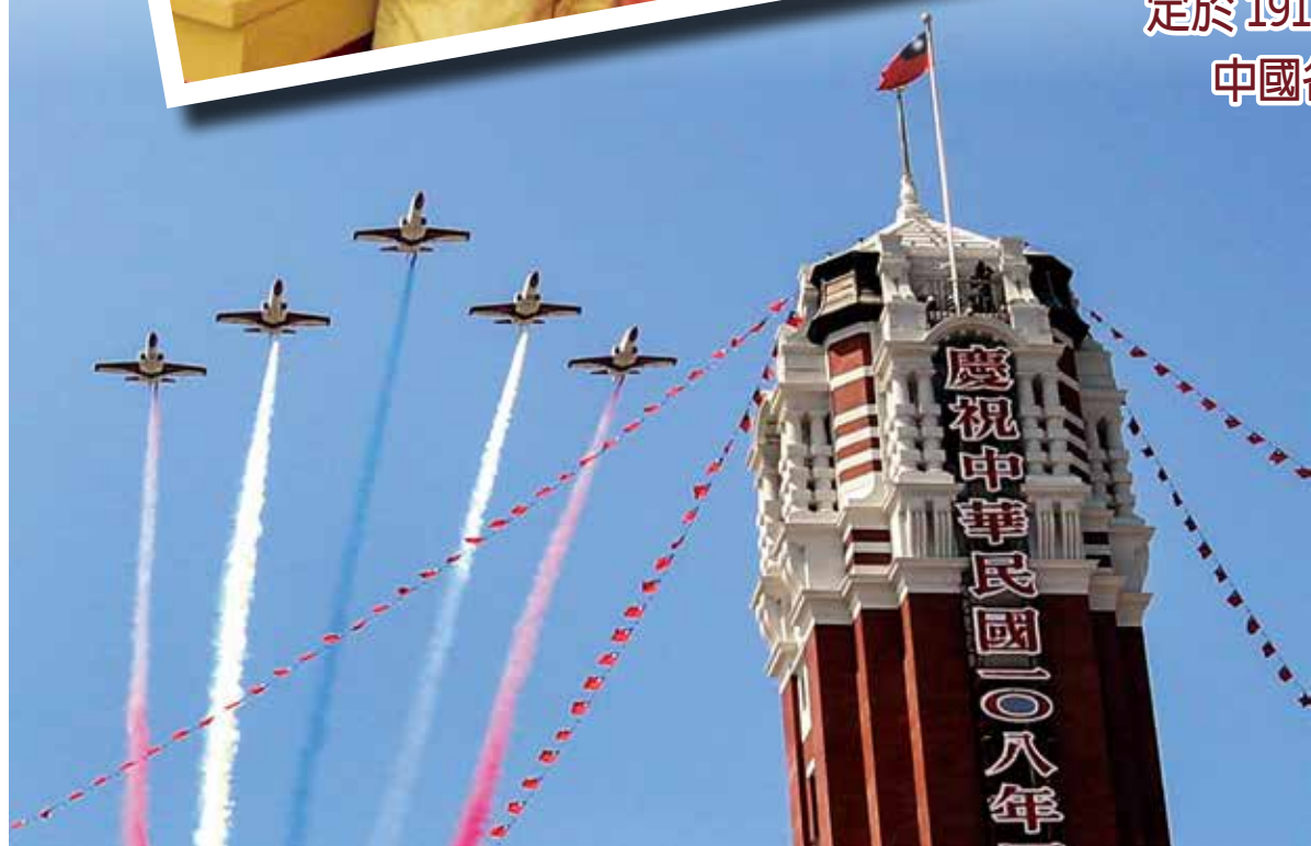
↑ 2019 年國慶日，雷虎小組 AT-3 教練機以彩色煙幕為大會畫下句點。