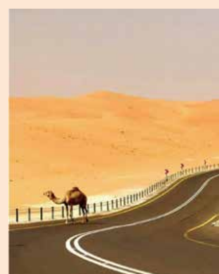
↑沙漠公路上的駱駝。