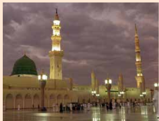
↑沙烏地阿拉伯第二聖城麥地那的先知清真寺。