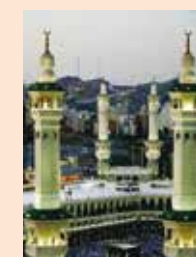
↑沙烏地阿拉伯聖城麥加禁寺。

在赴沙國履新之前所聞，「那是一個在荒漠上的回教國家」，「因信仰讓他們既保守又落後」，我們全家以沉到谷底的心境到了沙國，先不談外傳他們王室生活的奢華，我們全家以欣賞與接納異域生活的方式，假日到處旅遊，廣泛接觸了沙國各地的平民，我們認識了他們的民風樸實、真誠有禮。自美國介入中東事務後，各界的新聞大肆報導，與賓拉登領導下的恐怖組織，令人髮指的殘暴行徑，是完全相反的！我們全家離開沙國快四十年了，我們都很懷念在大漠的日子，那市集的風土人情、駱駝滿處的大漠風光，請先由幾張圖片，讓我們一同來欣賞他們的回教禮拜及麥加的朝覲聖地，圖中有一、二張不是沙國的，以此來證明，那不是外界偏見報導荒漠的阿拉伯世界。 因受篇幅影響，想先分享一張約在民七十三年初，於大使館巧遇金氏紀錄全世界最高的巨人，他是巴基斯坦人，身高有兩百七十四公分，我這一百八十公分的身高，還不到他的胸部，與他握手時好似小孩被大人抓個正著，頓時讓我有了天龍、地虎的感覺！ 欲知大漠拾趣續聞請待下回分曉！