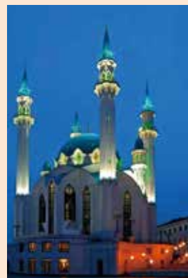
↑俄羅斯庫爾沙里夫清真寺。