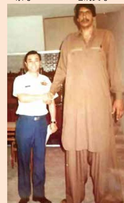
↑與全世界最高巨人合照。