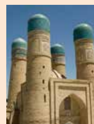
↑烏茲別克布哈拉四女兒塔清真寺。