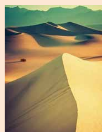
↑沙烏地阿拉伯大部分的土由不宜居的沙漠及貧瘠的荒野組成。