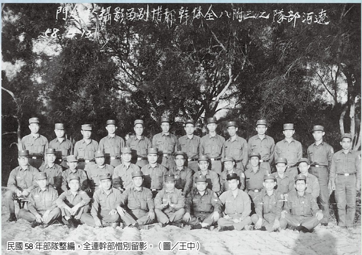
民國58年部隊整編，全連幹部惜別留影。

山上的天氣捉摸不定，時而晴空萬里，時而雲霧繚繞。我在陽明山雷達站一年半的日子裡有許多令人難忘的回憶。有一次盛夏晴天，在機房當班時，竟然連續打起早雷，逼得我只好跳上工作檯，躲避地上電纜線四處亂竄的火花，久久不敢下桌。事後，和同事到房頂一看，堅固的水泥磚瓦竟然被雷打出好幾個棒球大小的破洞，真所謂「晴天霹靂」。此外，在嚴冬下雪