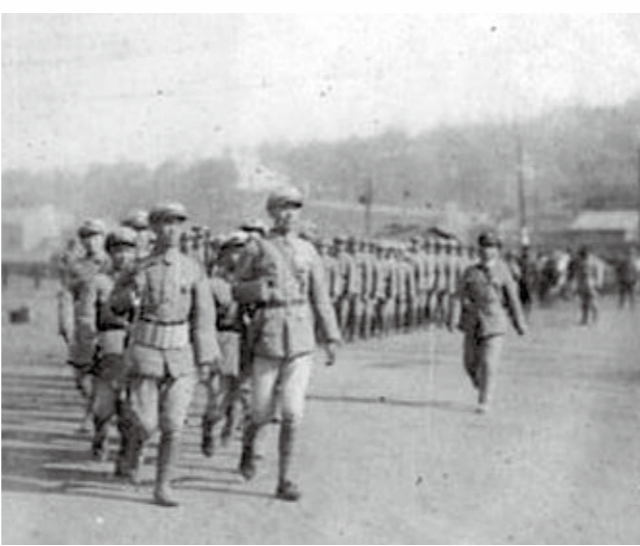
↑青年軍207師621團迫砲連第2班全體攝於西安。