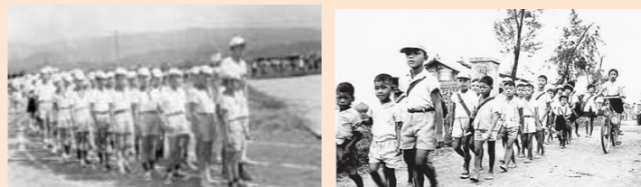
↑只有國定假日或學校排遊行、參與大型活動才要穿鞋，不穿鞋上課才是正常。