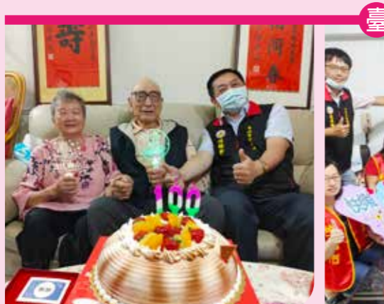
↑余林爺爺百歲仍相當硬朗。