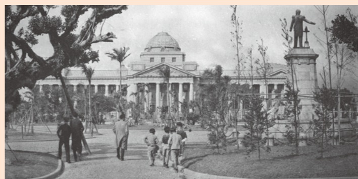
↑早年的新公園（今二二八紀念公園）。