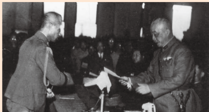
↑時任臺灣省最高行政長官陳儀（右）代表受降。