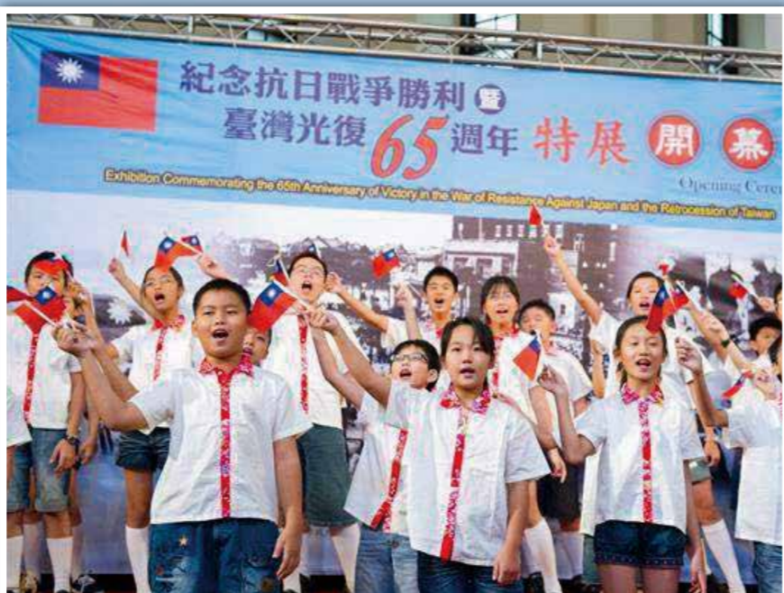
↑ 臺灣光復 65 周年，小朋友齊聚臺北中山堂慶祝。