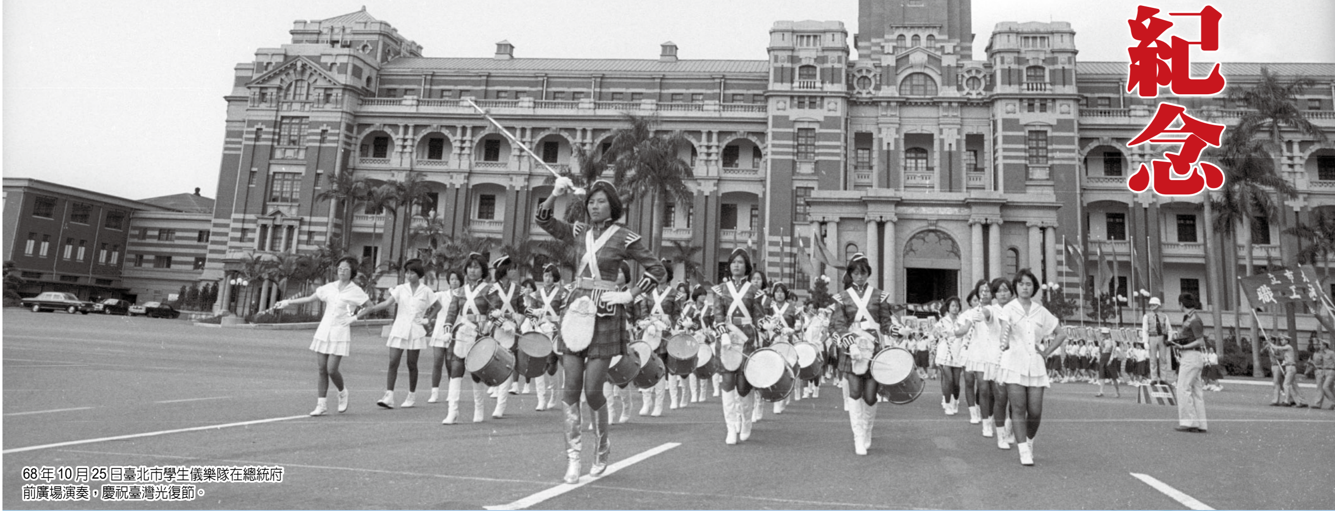
68年10月25日臺北市學生儀樂隊在總統府前廣場演奏，慶祝臺灣光復節。

碑文委員會等撰碑文，永誌懷念戰爭中犧牲的同胞，當年因為這些國軍將士犧牲生命抵抗外侮，國家現在才能有如此和平安樂的生活環境。 回顧歷史，國軍總是在國家危難之際，義無反顧肩負起保家衛國的重任，用血肉築起國家永續發展的長城，奠下國家穩定的基石，這是絕對不容否認的光榮史實，值得國人肯定與尊敬；而臺灣光復節的設立，不僅提醒我們應當飲水思源、心存感恩，莫忘先烈先賢的犧牲與他們為國奉獻的時代精神，同時更應珍惜今日得來不易的安定與繁榮，軍民團結齊心，持續為中華民國的未來與前途攜手奮鬥。