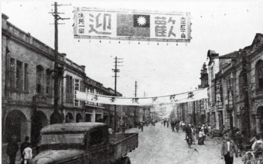
↑ 34年臺灣回歸中華民國懷抱，民眾高掛國旗慶祝。

不可抹滅的功勳 為了紀念這個意義非凡的日子，政府於民國三十五年明定十月二十五日為「臺灣光復節」；而後，八十八年十月二十五日於中山堂廣場建立「抗日戰爭勝利暨臺灣光復紀念碑」，以「歷史留言版」、「靜默沉思臺」為設計概念；到了一〇〇年，政府與「抗日戰爭勝利暨臺灣光復紀念碑」