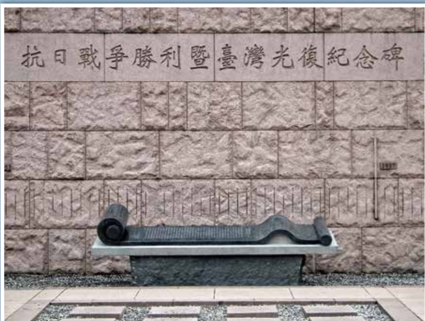
↑ 臺北市中山堂廣場前的抗日戰爭勝利暨臺灣光復紀念碑。