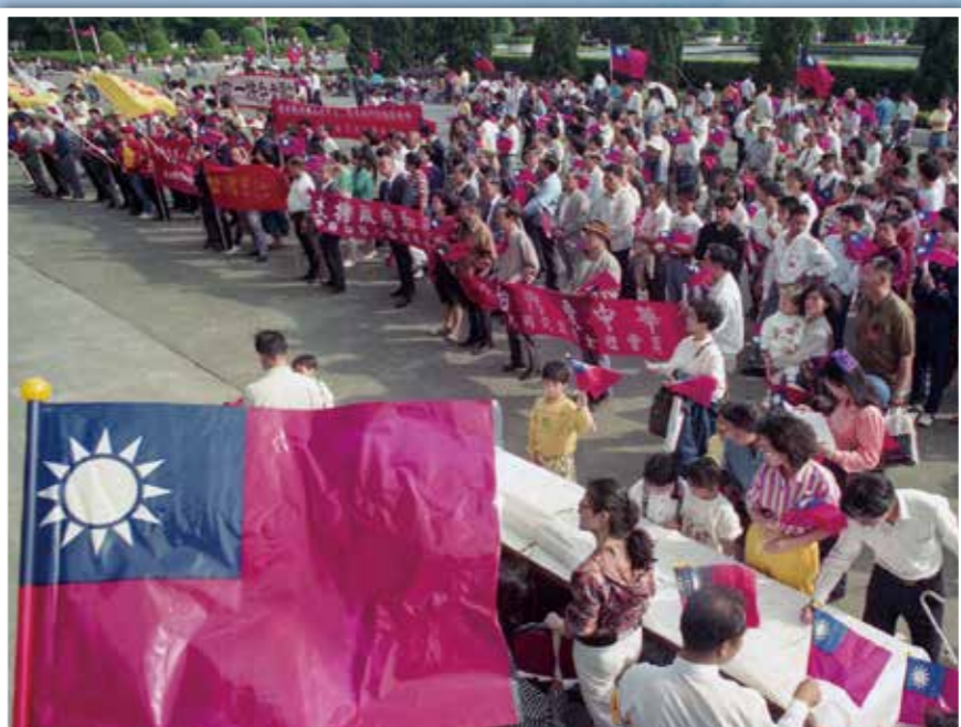
↑ 80年10月25日慶祝光復節，舉辦遊行。