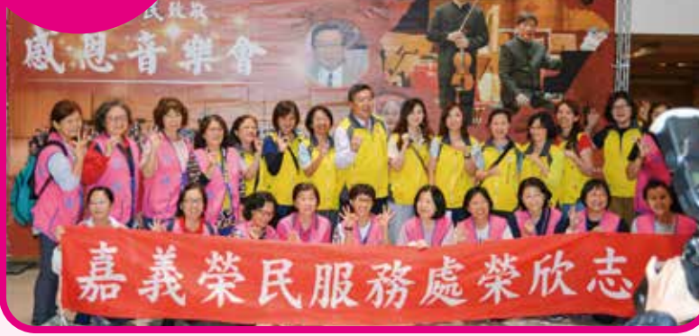
↑嘉義榮服處舉辦「向榮民致敬—感恩音樂會」，嘉義市長黃敏惠及嘉義縣長翁章梁都蒞臨現場向榮民們賀節。 ↓板橋榮家播映微電影《老朋友》讓榮民長輩感同身受。