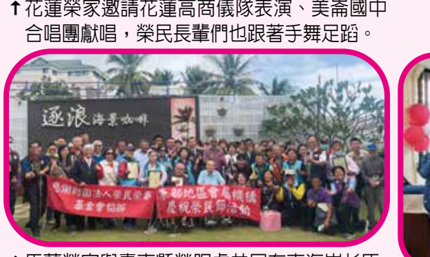
↑馬蘭榮家與臺東縣榮服處共同在東海岸杉原逐浪海景咖啡辦理戶外活動。