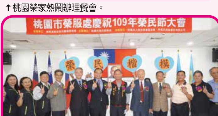
↑桃園市榮服處以「頌讚榮耀、愛在桃緣」為主題辦理活動。 ↓高雄榮家帶著長輩們一起體驗農場、搭火車、乘遊艇欣賞高雄港。