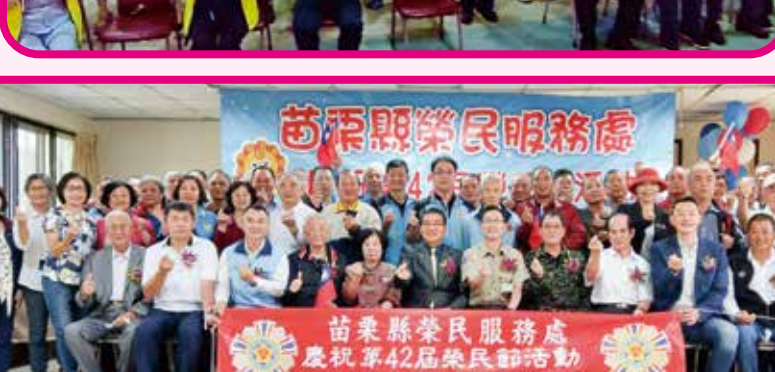
↑苗栗縣榮服處感謝榮民前輩們保衛並建設臺灣之辛勞。