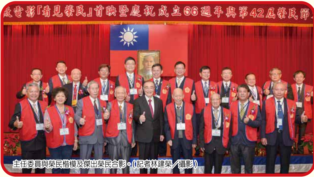
主任委員與榮民楷模及傑出榮民合影。