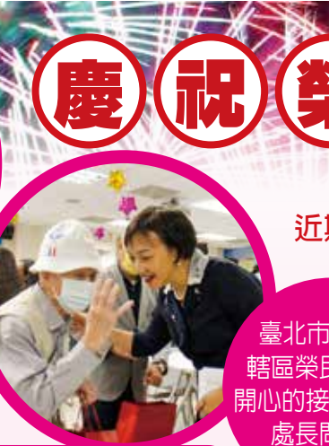
臺北市榮服處轄區榮民長輩們開心的接受榮服處處長問安。