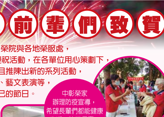
↑桃園榮家熱鬧辦理餐會。