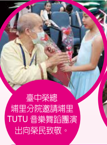
臺中榮總埔里分院邀請埔里TUTU音樂舞蹈團演出向榮民致敬。

10月31為榮民節，輔導會所屬各榮家、榮院與各地榮服處，近期都舉辦了輔導會成立66周年暨第42屆榮民節慶祝活動，在各單位用心策劃下，除了隆重的榮民節慶祝大會外，也舉辦熱鬧且推陳出新的系列活動，有才藝競賽、健康宣導、出遊訪問、藝文表演等，讓榮民前輩快樂的度過屬於自己的節日。