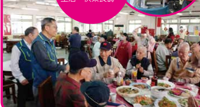
↑桃園榮家熱鬧辦理餐會。