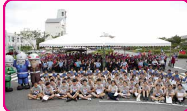
↑花蓮榮家邀請花蓮高商儀隊表演、美南國中合唱團獻唱，榮民長輩們也跟著手舞足蹈。