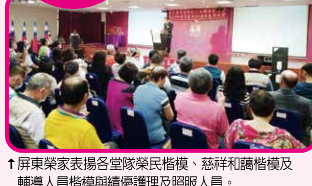
↑屏東榮家表揚各堂榮民楷模、慈祥與護照人員及輔導人員楷模與績優護理及照服人員。