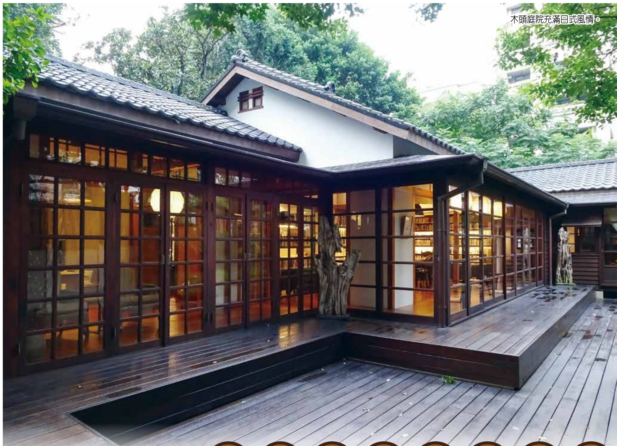
木頭庭院充滿日式風情。

服務 家歡迎符合 (眷)、遺 眾申請入住 榮家 市板橋區 段 32 號 22755157 榮家 市三峽區 127 號 26731201 榮家 市八德區 1217 號 3681140 榮家 市八德區 1100 號 3651285 榮家 市松嶺路 41 號 5213292 榮家 市桃源里 段 301 號 7222187 榮家 市田中鎮 段 421 號 8747647 榮家 市斗六市 160 號 5324100 榮家 市白河區 草 63 號 6852164 榮家 市七股區 147 號 7880664 榮家 市明路 190 號 2690418 榮家 市楠梓區 631 號 3652828 榮家 市燕巢區 路 1 號 6161214 榮家 市內埔鄉 100 號 7701621 榮家 市前路 29 號 8223111 榮家 市更生路 0 號 9222417 福田 市榮民榮眷 贈專戶 才團法人榮 基金會 行: 庫銀行 市路分行 次帳號: 9-626-734 局: 劃撥帳號 2111