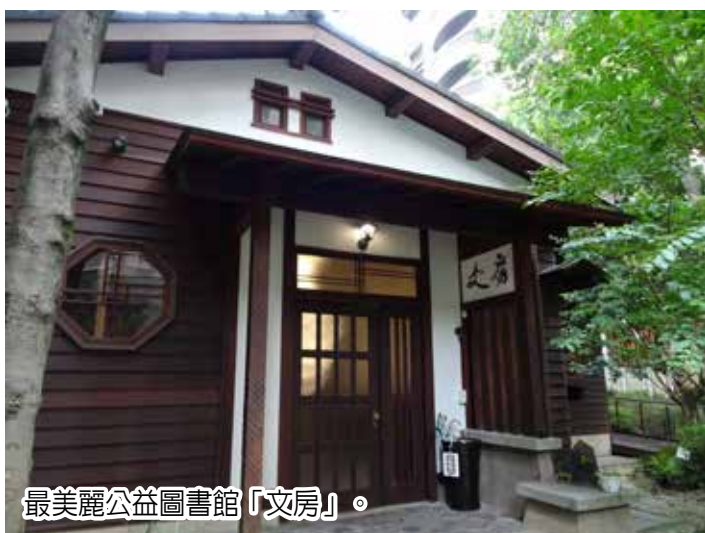
最美麗公益圖書館「文房」。