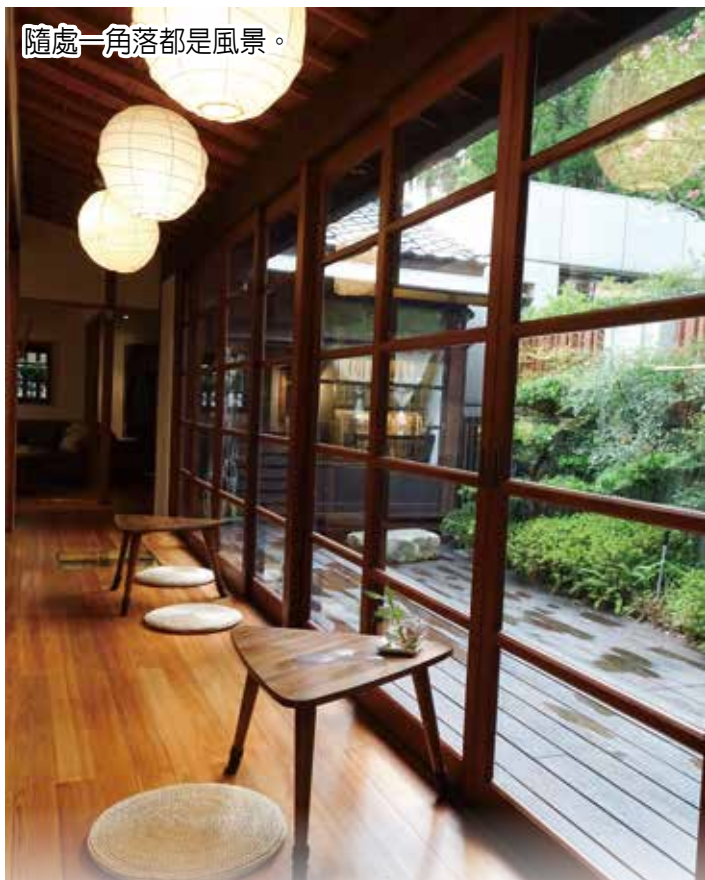
隨處一角落都是風景。