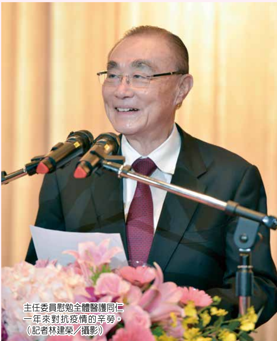
主任委員慰勉全體醫護同仁一年來對抗疫情的辛勞。

院及榮家，提升醫療技術及照護品質，並成功完成了全部十五所分院導入中榮資訊系統的不可思議任務，同時積極發展智慧醫療，建立友善的醫療環境，提升醫療服務品質，去年二度獲得醫療智慧醫院全機構獎，對中榮在智慧醫療領域長期耕耘，逐漸開花結果表達肯定。 主任委員指出，中榮在疫情期間仍不忘與國際接軌，派遣常駐醫師支援友邦（諾魯）國際醫療及協助防疫，並響應政府「以人為本」的新南向政策，持續與多國簽署合作備忘錄，醫療資源共享，辦理多場視訊研討會進行跨國交流，也促進友邦在國際持續為臺灣發聲，積極爭取臺灣擴大參與國際組織的機會。 高雄榮總醫師節慶祝大會與三十周年院慶共同舉行，主任委員蒞會指出，醫學界要團結，現今醫護人員資源短缺，高榮未來應與大學合作，培養與時俱進的新世代優秀醫師，培育更多未來的醫護人員。對於高雄榮總積極配合輔導會政策，推動金字塔三級整合計畫，精進榮家門診醫療服務及設施，整體提升榮家及榮院之醫療照護品質，主任委員也表示肯定。