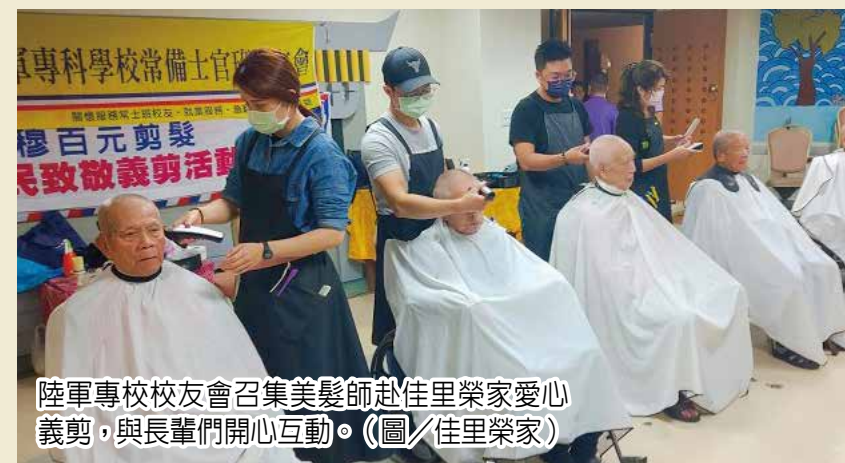
陸軍專校校友會召集美髮師赴佳里榮家愛心義剪，與長輩們開心互動。

好久沒到美容院理髮的寶媽媽表示，自己有些緊張，因為想剪一個漂漂亮亮的髮型，理髮志工細心傾聽長輩意見，一邊細心修剪一邊確認髮型是不是長輩所喜歡的，貼心態度讓許多長輩喜起大拇指稱讚不已。考量臥床長輩不便下床，理髮志工親自來到病床前為長輩們理髮，一邊輕聲安撫臥床長輩緊張情緒，新髮型讓長輩感到十分滿意，露出笑容。