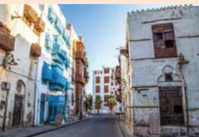
↑在吉達找了三層樓的公寓，我租了第一層。

是用來購物時用的，我看秘書的手勢是要買一塊各三公斤(沙國用公)的牛肉，我仔細看這位肉販，黝黑、瘦小的個兒，包紮的頭巾顏色像廚房久用的抹布，我猜他是某門人，看他一刀切下去，一秤三公斤多，秘書只要三公斤，再切又一切，秤了又秤，像裝了一袋碎肉，另外三公斤亦復如此，秘書面露慍色，提了肉就去買別的東西了，我對肉販比手勢再說「搭那達」(三)，他就點頭同意了，看他一刀下去，一秤快三公斤半，我說「麻類許」，他切另外一塊又超出三公斤，我說「哈拉斯」，這個肉販高興的笑了，我付錢時多給他幾塊錢，他還退了一塊錢給我，他切肉的刀藝怎麼能和我們大拜拜、殺神豬請來的師父，可以一刀一斤的切成條，還秤給我們看，得到不少掌聲相比呢？ 我買的肉包好了，他要了我的車鑰匙，叫站在門口的一位打零工的某門人，幫我拿去車裡放，同時比手勢要我去買別的東西。等我買了其他物品，去拿鑰匙打開後車廂發