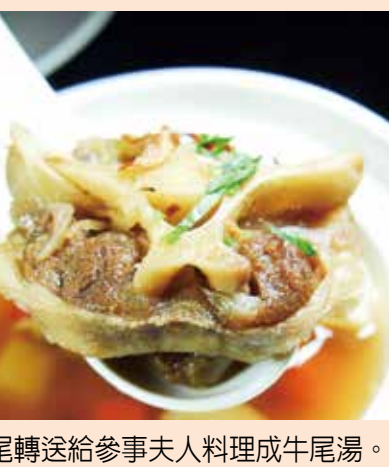
↑牛尾轉送給參事夫人料理成牛尾湯。