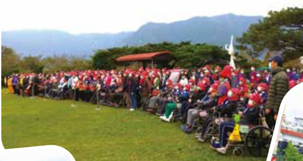
→花蓮榮家元旦升旗典禮，長者們感受一元復始，萬象更新。（圖／花蓮榮家）