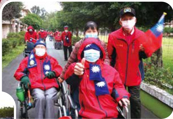
↓新竹榮家慶祝元旦，榮家伯伯穿戴保暖方巾、手持國旗及感謝標語，現場一片喜樂洋洋氣氛。