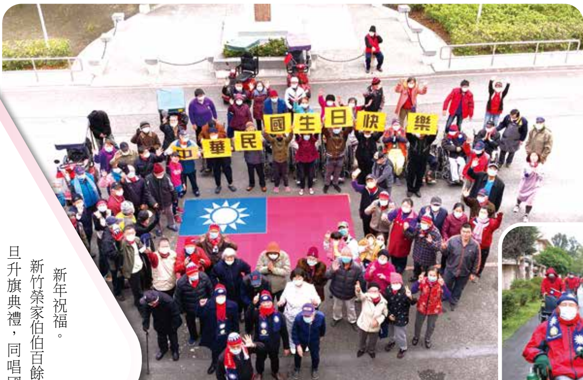
←彰化榮家住民攜手以特製的塑膠地墊拼成國旗，並圍聚在國旗四周，展現團結愛國精神。