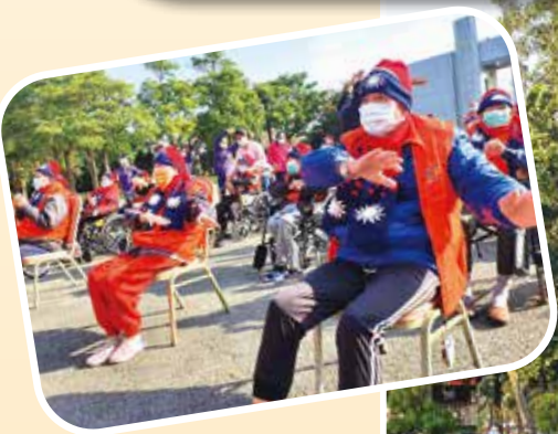
↑佳里榮家長輩頂著寒風參加升旗典禮後，做健身操，迎來平安、健康的新年。

【連線報導】中華民國一一〇年元旦逢寒流來襲，但各榮家長輩仍興致高昂，穿著國旗裝，揮舞國旗，踴躍參加升旗典禮，大家齊聲高唱國歌、國旗歌，高喊「中華民國萬歲」，迎接新的一年。