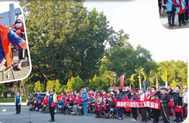
↑屏東榮家於家區行政大樓前廣場舉行元旦升旗典禮，榮民長輩展現朝氣與熱情。