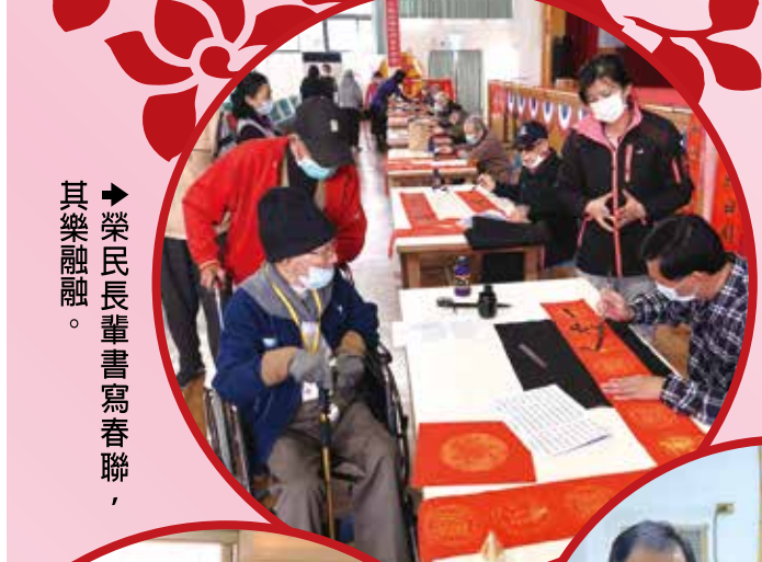
▲榮民長輩寫春聯，其樂融融。

恭賀新年到！輔導會所屬各榮家、榮院及榮服處紛紛趕赴榮民（眷）的住處關懷送暖，舉辦揮毫贈春聯、新春義剪等活動，讓榮民長輩提前感受到年節的歡樂氣氛，滿心歡喜地迎接金牛新年的到來。