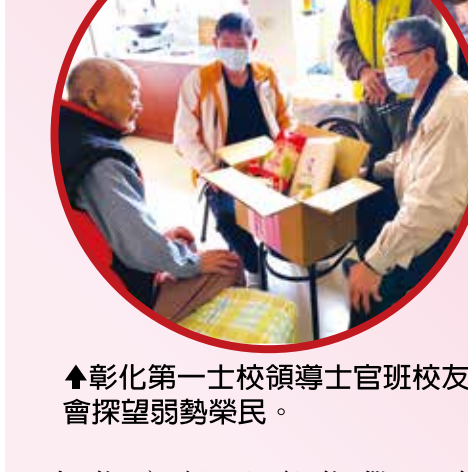
▲彰化第一士官校領導士官班校友會探望弱勢榮民。