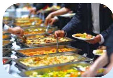
▲在沙國，不吃豬肉是大家耳熟能詳的事。