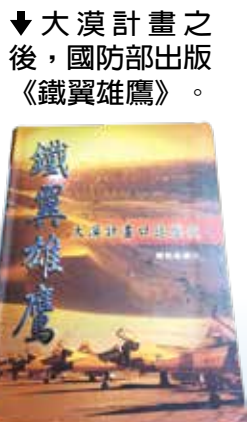
▲大漠計畫之後，國防部出版《鐵翼雄鷹》。