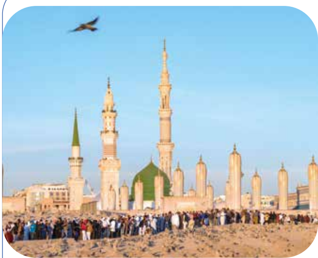
▲篤信回教的沙烏地阿拉伯，清真寺林立。