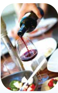
▲喝酒是沙烏地阿拉伯禁忌之一。