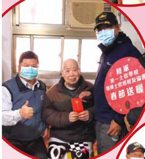
▲桃園市領導士官班校友協會將愛與溫暖，傳送給需要幫助的榮民。

恭賀新年到！輔導會所屬各榮家、榮院及榮服處紛紛趕赴榮民（眷）的住處關懷送暖，舉辦揮毫贈春聯、新春義剪等活動，讓榮民長輩提前感受到年節的歡樂氣氛，滿心歡喜地迎接金牛新年的到來。