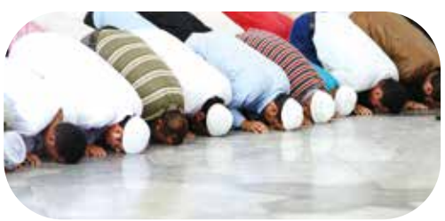
▲沙國人每次禮拜都非常虔誠。