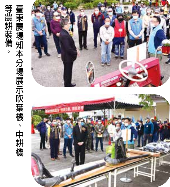
臺東農場知本分場展示吹葉機、中耕機等農耕裝備。