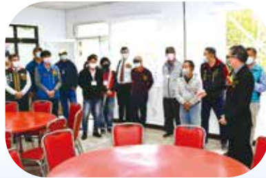
周副主委與學員參觀知本分場相關設施。