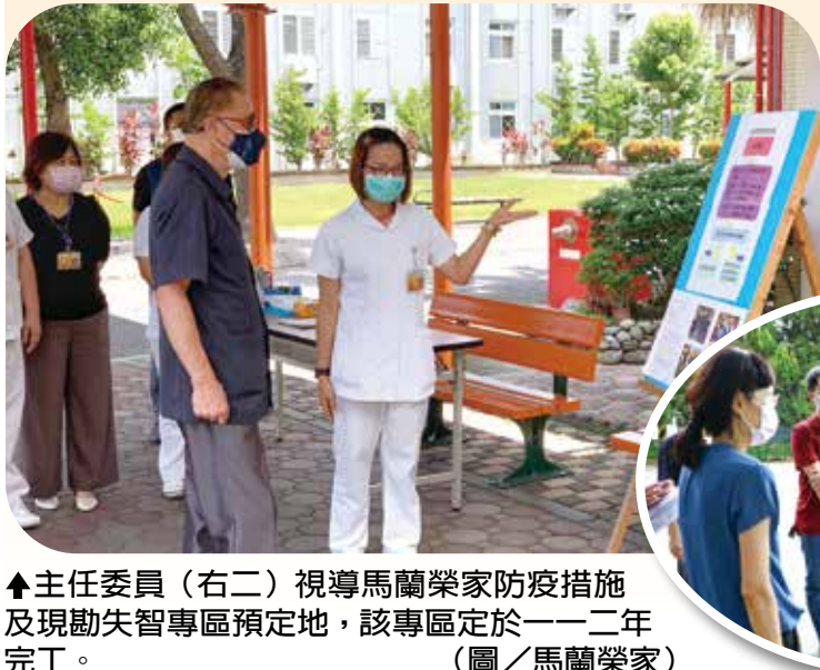
▲主任委員(右二)視導馬蘭榮家防疫措施及現勘失智專區預定地，該專區定於一二年完工。

【本報訊】關心失智專區中程計畫推動情形，主任委員馮世寬及副主任委員呂嘉凱分赴馬蘭榮家和八德榮家視導，主委在馬蘭榮家指示，失智專區建築外觀應採溫馨休閒風格，與自然景觀融合，並著重「綠能」與「智能」，期許創建真正符合長輩需要的榮智願養環境。