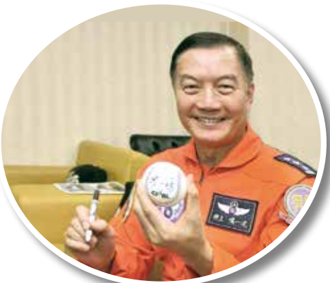
▲故參謀總長沈一鳴上將功在社稷，又十分親和，令人懷念。