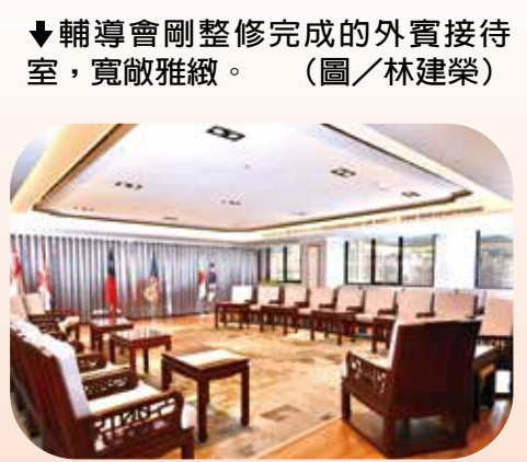
▲輔導會剛整修完成的外賓接待室，寬敞雅緻。