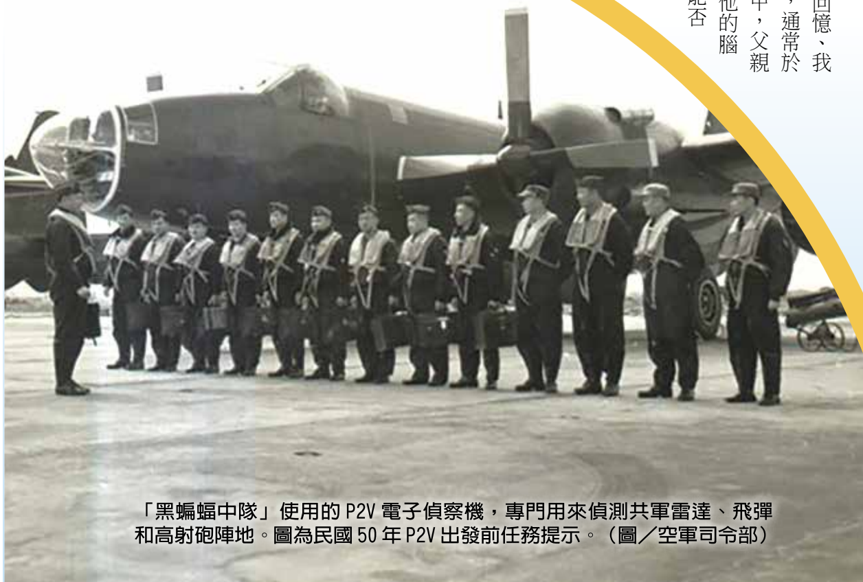
「黑蝙蝠中隊」使用的P2V電子偵察機，專門用來偵測共軍雷達、飛彈和高射砲陣地。圖為民國50年P2V出發前任務提示。

新竹市「黑蝙蝠文物陳列館」內展示當年出任務的模型偵察機及多張老照片，記錄那段驚心動魄的歷史。