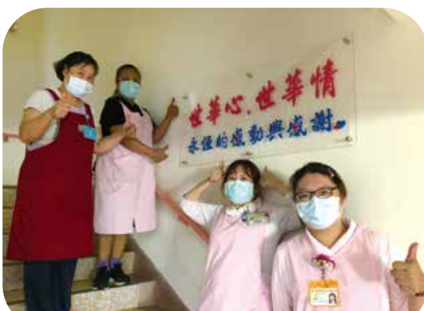
桃榮附設松柏園護理之家醫護人員，於牆面製作溫馨感謝詞，表達誠摯的謝意。