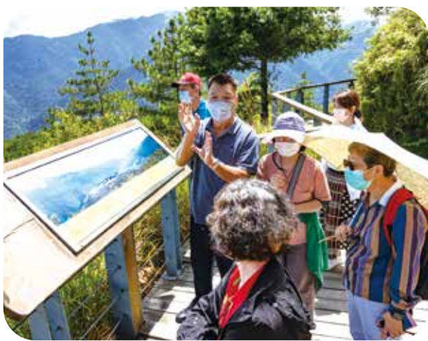
李副主委（左）與性平委員視導福壽山農場，關心高山遊憩區性平與無障礙設施設置情形。

【本刊訊】副主任委員李文忠日前陪同輔導會性別平等小組外聘委員郭素珍、何碧珍，前往會屬武陵農場及福壽山農場，視察性別友善設施，包含哺（集）乳室、性別友善廁所、無障礙廁所、親子停車位及無障礙停車位等設施，希望持續改善並建置農場環境及性別友善設施。兩位性平委員針對現有設施提供了專業意見。