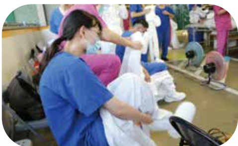
▲北榮醫護人員支援防疫工作前，於酷熱天氣中全副武裝穿著防護衣執行勤務，相當辛苦。

我鼓勵他們要發即時的新聞，而且要圖文並茂，妥為運用媒體來傳播我們各級榮院由防疫、檢疫到為民注射所付出的心力、努力與成果，坊間不是流行一句：以前是「慧眼識英雄」，現在是「會演是英雄」嗎？今天臺北榮總編輯成了《精進現況 儲備未來 Covid-19 防疫專刊》，當許院長要我為此專刊寫序，我覺得義不容辭，特將我寫的序文與大家分享如下：