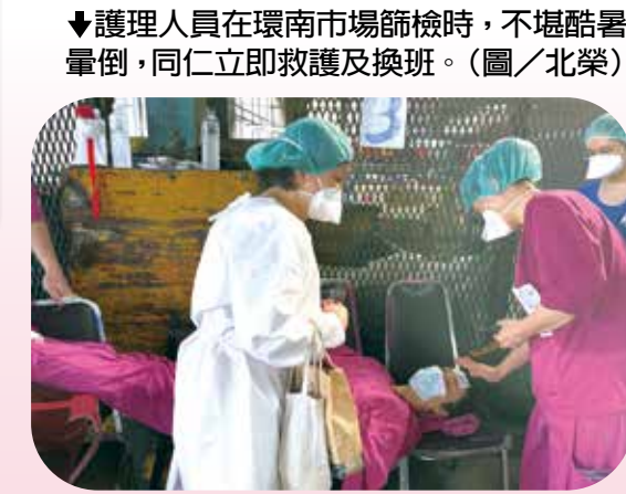
▲護理人員在環南市場師檢時，不堪酷暑暈倒，同仁立即救護及換班。