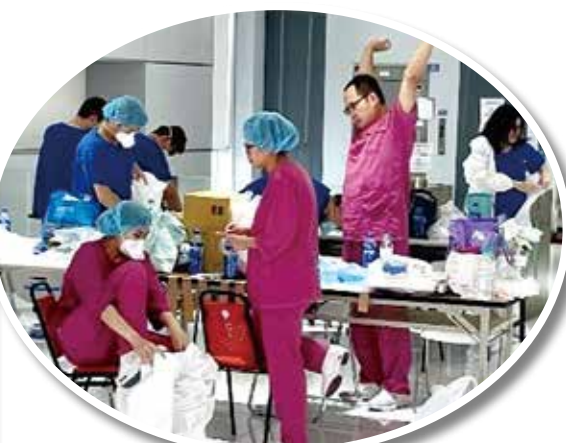
▲醫護在休息室穿脫防護衣，準備換班，雖然勞累，伸個懶腰，繼續奮戰。