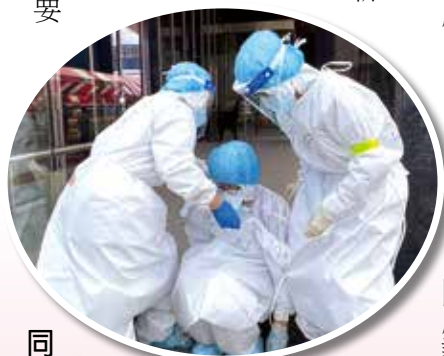
▲護理人員支援防疫工作，辛苦，體力不支癱倒，同仁扶持照護。