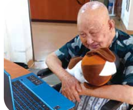
▲彰化榮家，因獨自一人，不必戴（口罩）。