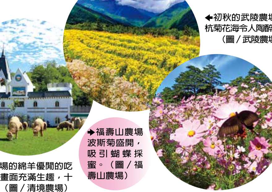
▲初秋的清境農場，杭菊花海令人陶醉。

目前武陵農場百日草花海盛開，福壽山農場波斯菊也盛開，預計賞花期持續到十月中旬，甜美的蘋果、雪梨陸續採收，緊接著秋天最美的楓紅將陸續登場。