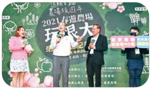
▲主委期盼會屬農場應服務平民大眾，日前推動「春遊農場玩很大」活動，大力促銷農場旅遊。（圖／輔導會）