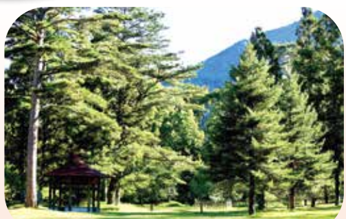
▲武陵農場的參天巨木及高山綠野，令人心曠神怡。