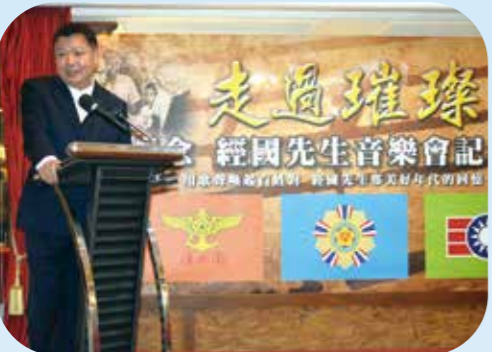
李副主任委員在記者會中，推崇經國先生對國家的偉大貢獻。

【本刊訊】元月十三日是經國先生逝世三十四週年的日子，為感念他創建輔導會、政工幹校、出任救國團主任，及對臺灣的付出與貢獻，當天將在臺北市「大安森林公園露臺音樂臺」舉辦音樂會，表達對經國先生的懷念與追思。