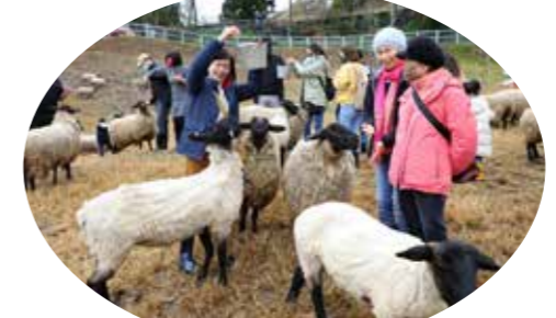
國軍楷模家屬在綿羊基地，與可愛的綿羊近距離互動，把塵囂澈底拋開。

【本刊訊】輔導會和國防部於耶誕節假期合辦兩天一夜的「榮耀國軍、楷模致敬」活動，有十七位國軍楷模和家屬共七十三人到清境農場愉快度假，感受層層疊疊、如詩如畫的清境美景，並由輔導會設晚宴款待，由副主任委員陳曉明全程陪同，讓國軍楷模備受尊崇和禮遇，留下最美好的回憶。 國軍楷模和家屬於十二月二十五日下午，抵達清境農場，第一站到達青青草原，欣賞「綿羊秀」，伴隨著觀眾的驚呼，成群綿羊由牧羊犬引導驅趕，從山坡上如瀑布般傾洩而下，壯觀又可愛。接著到觀山牧區，欣賞精采的馬術表演。 晚宴於國民賓館舉行，先由陳副主任委員與政治作戰局長簡士偉中將交換禮物，再由國防部藝工隊演出，同時進行摸彩，最後由陳副主任委員帶領輔導會團隊高歌後，加碼三份抽獎禮，將活動氣氛推到最高點。