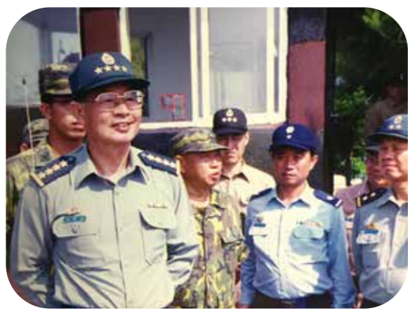
↑湯前部長任參謀總長時，視導陸軍部隊。