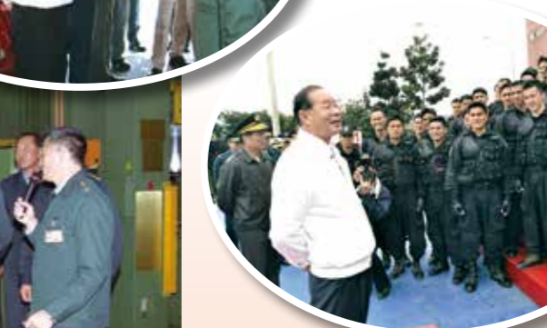
↑愛國者飛彈為空防重要武器，湯前總長前往基地視察。