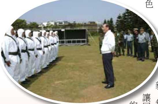
↑六軍團化學兵群全員身穿白色防護衣，聽取湯前部長的慰問及鼓勵。