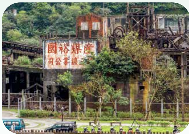
掛有斗大標語「產煤保國」的瑞三鐵業整煤廠，被列為歷史建築。

寧靜猴硐 當年產煤盛況 平溪線起點為三貂嶺車站，但大部分列車皆以瑞芳或八堵為出發車站，會先到猴硐站，以此作為旅行的起點，再適合不過了，一到這兒，便可感受到山城的寧靜與平和。猴硐（侯洞）早期稱「猴洞」，傳說早年一處山洞有群猴居住，後來隨著人們進住，金煤礦業興起，產業坑道忌諱有水，便將「洞」的水字邊改為「硐」的石字邊，後來經國先生來視察煤礦產業，認為「猴」不雅，便取諸侯的「侯」字，最後經地方人士正名改回，保留當地特色。值得留意的是猴硐車站建構特別高挑，原因是過去有鐵軌穿越其中，可直接讓貨車停放火車旁，便於運送煤炭。據說在金礦與煤礦生產興盛的年代，猴硐一帶更有上萬人聚居。在猴硐車站附近，更能顯現當時的盛況，牆上掛有斗大標語「產煤保國」的「瑞三鐵業整煤廠」，建於日據大正九年（西元一九二〇年），瑞三鐵業公司在猴硐一帶開發礦坑，本坑與新坑等礦坑，瑞三鐵業整煤廠的主體為三層樓建築，一樓為鋼筋混凝土結構，可供車輛運送煤炭，二樓以上為木建築，為選洗