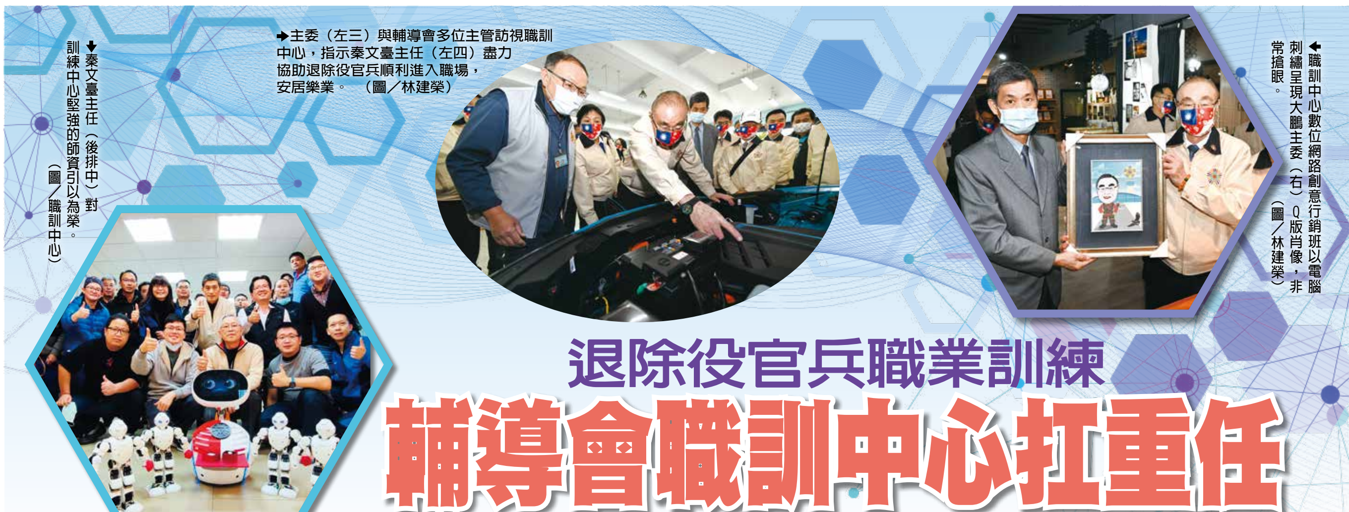
▲職訓中心數位網路創意行銷班以電腦刺繡呈現大鵬主委(右)Q版肖像，非常搶眼。