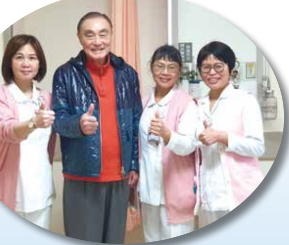
▲主委出院時，向病中照顧他的護理師致謝。