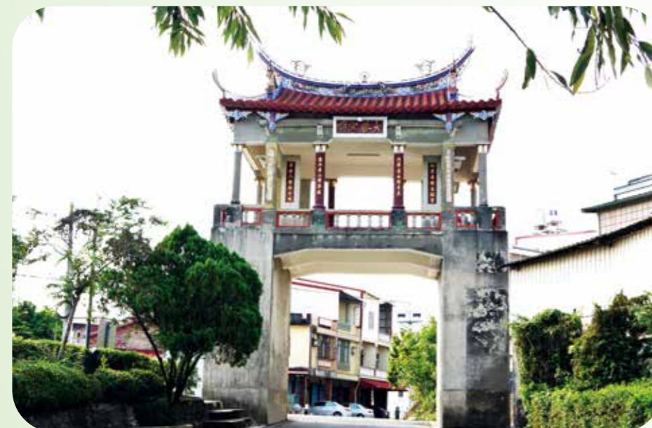
美濃東門樓位於永安路，在貫穿庄頭庄尾的主軸線上，見證美濃庄開庄的歷史。 (圖／高雄市美濃區公所)

農場周邊 體驗傳統客家文化 高雄農場所在地美濃，為臺灣南部地區客家人主要聚居地，約九成以上人口為客家籍，因屬山區平原且親族間關係密切，所以美濃不論在語言、食物與房屋建築方面，至今仍保留許多傳統客家文化與風俗。民國九十年設立的美濃客家文物館，建築以於樓造型與三合院設計，將客家文化與歷史保存其中，民眾到此可藉由兩層樓的展示空間，認識在地豐富的客家文化生活。 美濃客家文物館一樓為特展室、文物展覽室與主題館，二樓則為慶典文物室與兒童探索室，館內有豐富的歷史文獻、相片、錄影帶與實物等，成為遊客到美濃必訪的景點之一。