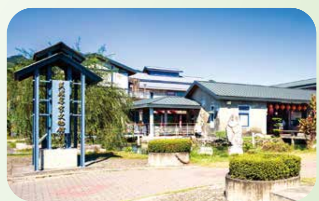
美濃客家文物館將客家文化濃縮其中，是親子共樂共學的絕佳場域。

湖泊濕地生態豐富 風光秀麗 美濃湖位於美濃客家文物館的西南方，距離不遠，步行十五分鐘即可抵達。美濃湖原稱中圳湖、瀾濃湖、中正湖，座落於高雄美濃的大坑溪與美濃子寮溪匯流處，面積約二十一公頃，為高雄第二大人工湖（僅次於澄清湖）。初建於乾隆年間，日據時代改建為水庫，為在地居民日常生計與農耕灌溉的重