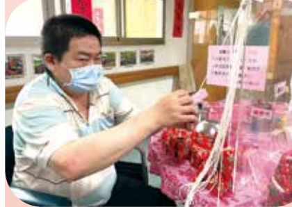
屏東榮家曾拿槍捍衛國家的硬漢長輩綁粽子，竟綁得有模有樣。