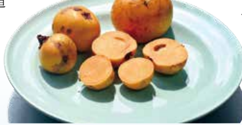
▲切開的福果，果瓢也是黃色的，味甜。（圖／林建榮）