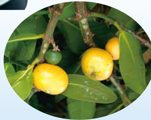
▲福木上結了黃澄澄的福果，相當誘人。