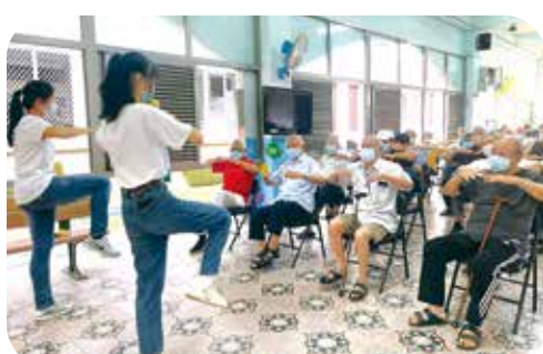
義守大學學生以「練武功」歌曲，邀請榮家長輩動一動，長輩做起一點都不含糊。