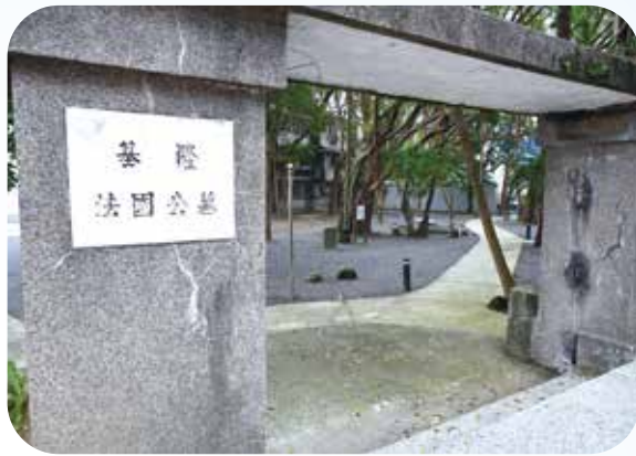
法國公墓是臺灣少見的外國人墓地紀念碑。

基隆曾是知名的兩都，也是曾是臺灣最繁忙的港都，如今，碼頭日夜卸貨的榮景雖不復見，但因從古至今扼守臺灣北疆，留下許多與戰爭相關的史蹟，讓老城散發出雋永的文化魅力。