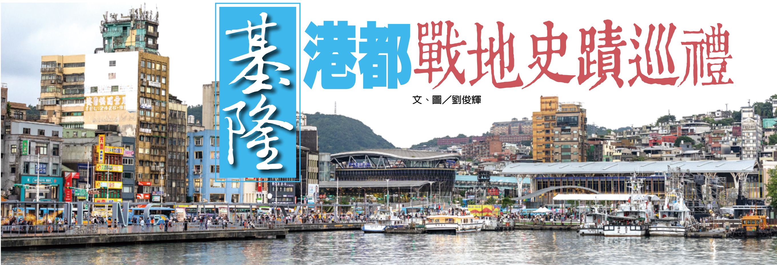
▲港都基隆有特殊的山海景觀與人文魅力，也是遊人樂於造訪的觀光城市。

基隆曾是知名的兩都，也是曾是臺灣最繁忙的港都，如今，碼頭日夜卸貨的榮景雖不復見，但因從古至今扼守臺灣北疆，留下許多與戰爭相關的史蹟，讓老城散發出雋永的文化魅力。