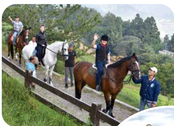
▲清境農場的小徑上，主委偕友人騎馬觀山景，自在如意。

我從小就莫名地對馬有一種特殊的好感，在那個（民國五、六〇）年代，我們都喜歡看西部牛仔片，看電影裡的西部牛仔「約翰韋恩」，口裡叨著雪茄，騎馬奔馳，不論馬上下，與歹徒決鬥時，槍法精準；而馬，只要他一開口，就會自動過來讓他騎乘飛奔。