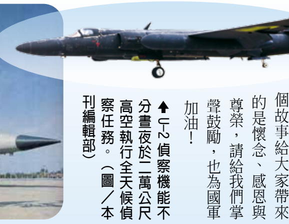
▲「偵察機能不分晝夜」二萬公尺高空執行全天候偵察任務。

「回家的路怎麼這麼長！在油量幾乎全部耗盡時，我終於安全降落在中華民國空軍桃園基地了！」