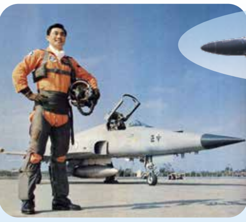
▲大鵬主理擔任飛行教官時，於下品戰機前留下英姿。

「深夜外子回家後疲憊不堪，累得都沒精神說話了，我在幫他脫飛行衣時，愕然看到他背上佈滿了像被鞭打過似的，一條一條紫紅色的血痕，他已麻木得沒感覺刺痛了，那是因為「個裝士」沒把他的「高空壓力衣」穿好所致，在我給他塗抹潤膚油時，忍不住心痛的眼淚一滴一滴地滴在他的背上！」