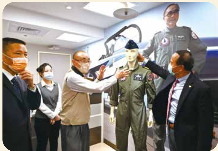
欣欣百貨設立「國軍服裝提領處」，是百貨界的一項創舉。

民國61年6月28日欣欣百貨開幕營業，至今已51年，是臺北現存歷史最悠久的百貨公司。