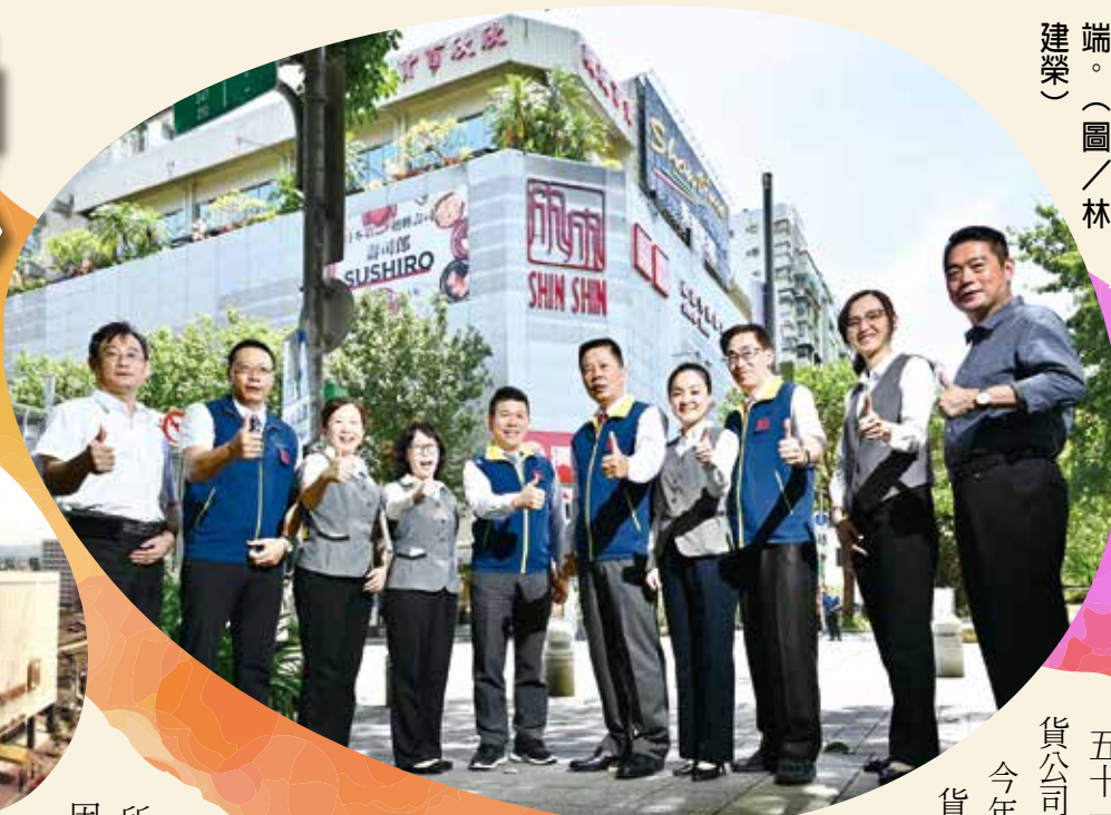
尤董事長（右五）帶領同仁與時俱進，讓欣欣百貨始終走在時代潮流前端。

欣 欣大眾百貨公司由輔導會及民間共同投資，於民國六十一年成立，持續經營了五十一年的全臺現存最老牌百貨公司，走過疫情嚴峻的艱苦時期，今年迎來全新經營型態，再寫百貨業傳奇。