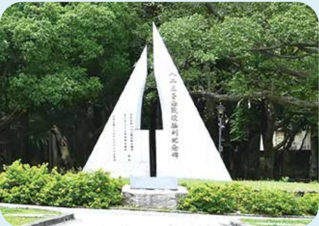
臺北圓山八二三砲戰紀念公園設立紀念碑，彰顯此戰獲勝的榮耀。

金門砲戰期間，我空軍共出動各型飛機逾九千架次，其中防空警戒巡邏近五千架次，對運輸船團及空投偵照等掩護逾兩千架次，進入共區偵察及空投傳單逾兩百架次，空運達七十四架次，空投補給逾六百架次。總計毀傷中共米格十七型戰機三十二架，如此輝煌之戰果，確保了八二三砲戰的勝利，迎來了臺灣日後的安定與繁榮，確保國家安全於迄今。