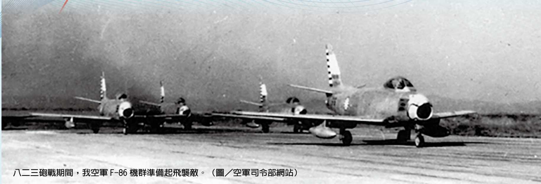
八二三砲戰期間，我空軍 F-86 機群準備起飛襲敵。