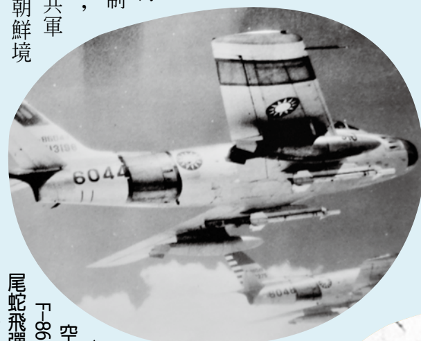
▲九二四溫州灣空戰中，我空軍 F-86 戰機首次使用響尾蛇飛彈。