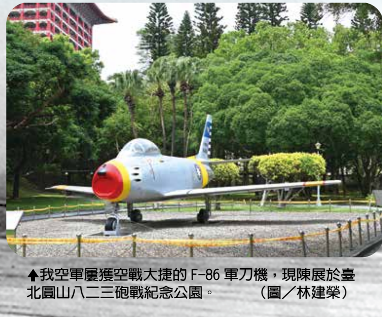
▲我空軍屢獲空戰大捷的 F-86 軍刀機，現陳展於臺北圓山八二三砲戰紀念公園。

每年八月十四日為我「空軍節」，肇因於民國二十六年七月七日日本繼興兵發動盧溝橋事變後，復於八月十三日於上海發動淞滬會戰，翌日上午我空軍派遣戰機轟炸虹口、匯山碼頭等日軍據點多處，下午日軍為報復我空軍襲擊，日機大舉來犯，轟炸虹橋、杭州、蘇州、廣德等我國空軍基地。當時我空軍雖裝備劣勢，但士氣如虹，由第四大隊大隊長高志航率機迎敵，發揮「我死則國生」的戰鬥精神，於笕橋與廣德空域力挫日機，戰果輝煌。民國二十八年九月，國民政府紀念抗戰期間首次的空戰勝利，為激勵士氣，期以效法先賢先烈的犧牲衛國精神，明定每年八月十四日為「空軍節」。