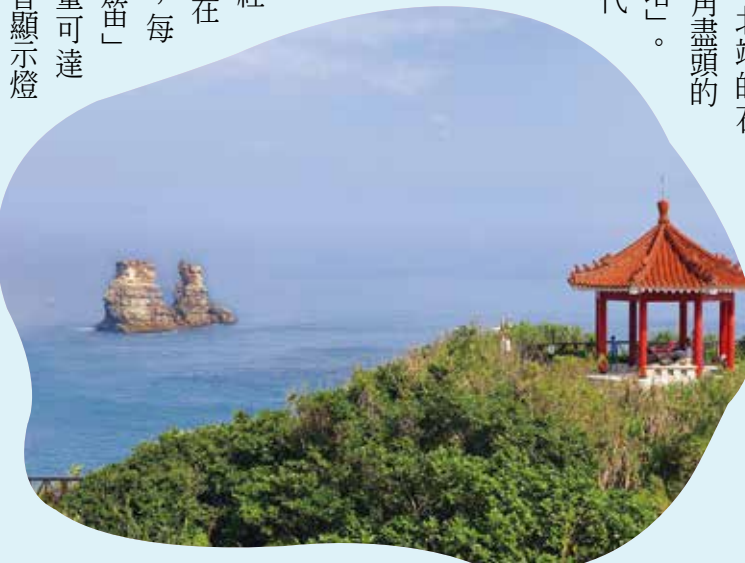
「燭臺雙嶼」是金山區知名的勝景。

此燈塔是日據時代在臺灣興建的第一座燈塔，當時日本人要建造臺灣與日本之間的海底電纜及航路設備，但因特殊的地理環境及氣候，富貴角一帶秋、冬時期經常出現濃霧，所以在塔內附設「霧笛」，每當濃霧籠罩，「霧笛」就定時吹鳴，音量可達三、四海裡，藉由音顯示燈塔位置，協助船隻辨明方位，維護航行安全。