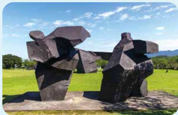
朱銘美術館是金山另一處知名景點。

近年更因復育有成，偶爾還可在步道上遇見「臺灣百合」或「金花石蒜」怒放美景。來到步道盡頭，因板塊運動與自然侵蝕作用雕塑而成的知名景觀「燭臺雙嶼」便矗立眼前。經歷大自然六百萬年時間精雕細琢，宛如巨型燭臺的巨石立於海中，從遠亭觀景臺外望，成為金山著名的景點。