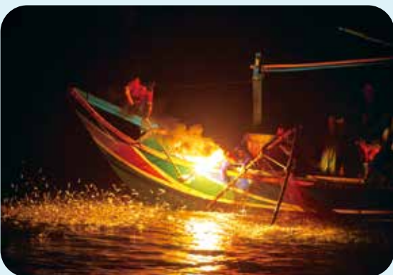
「金山礦火季」以特殊捕魚漁法吸引遊客。

近年更因復育有成，偶爾還可在步道上遇見「臺灣百合」或「金花石蒜」怒放美景。來到步道盡頭，因板塊運動與自然侵蝕作用雕塑而成的知名景觀「燭臺雙嶼」便矗立眼前。經歷大自然六百萬年時間精雕細琢，宛如巨型燭臺的巨石立於海中，從遠亭觀景臺外望，成為金山著名的景點。