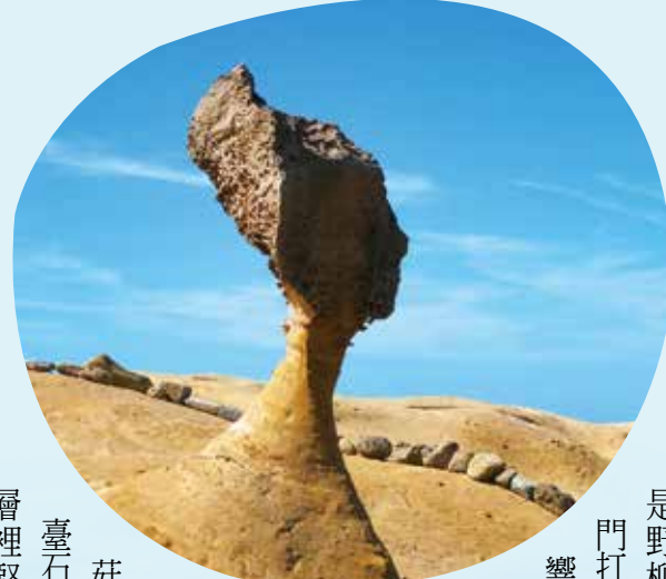
「女王頭」是野柳享譽國際的地標。

享譽國內外的「女王頭」是野柳具代表性的地標與熱門打卡點，不過因為風蝕影響，近年女王的脖圍越來越小，產生無法長久維持的疑慮；另一個「俏皮公主」有著綁馬尾的造型，因而被稱為女王頭的接班選擇。在野柳最容易被遊客親近的，是一朵