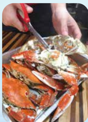
「萬里蟹」打出品牌之後，成為許多饕客入秋之後喜愛的美食。

面「蹦」出火花，瞬間吸引向光性極強的青鱗魚躍出海面，點點光彩的畫面成為只有親眼目睹才能領會的感動。九月也是新北市的地瓜盛產期，金山是新北最大產區，種植面積超過九十公頃，受到火山黑壤土質及帶有鹽分的海風吹襲等因素影響，種出的地瓜口感綿密細緻，是金山重要的物產，來到這裡不妨順便帶些回家。