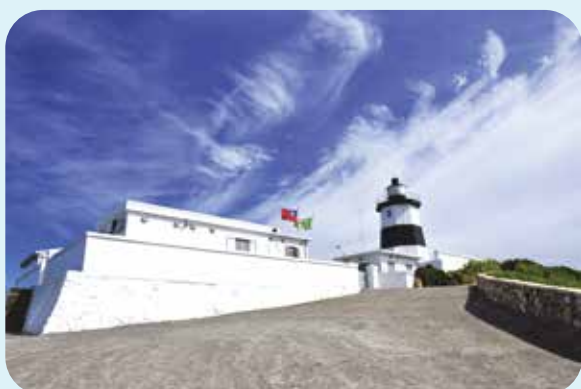
黑白相間的富貴角燈塔。

位於臺灣本島最北端的石門區，地名來源最早出現在清康熙三十三年鄭開極編修的《福建通志》，書中寫道：「石門山，旗干石西，一石中空如圓門，故名。」如今位於濱海公路省道上的「石門洞」，不但是地名來源，也是石門區的顯著地標。石門洞在地形學上的正式名稱為「海蝕拱門」，起因於百萬年前大屯火山群噴發，堆積了厚厚的火山碎屑和熔岩，往後被豪雨沖刷，重新形成一層層的岩層，再經地層擠壓，裂出垂直的節理，加以東北季風掀起高漲浪