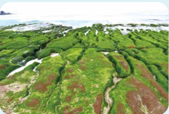
「老梅綠石槽」是近年石門頗為熱門的景點。

位於石門區東南方的金山，背山面海，舊名「金包里」是由平埔族社名翻譯而來，名稱最早見於清康熙三十九年郁永河著作的《裨海紀遊》。此地本由平埔族開拓，清末福建泉州兩地移民陸續來此。因三面環山，日據時代，日本人保留了「金包里」的「金」字，改名為「金山」。金山區的景點不少，像是舊稱中正公園的獅頭山公園，坐落於北海岸的金山岬上，海拔約七十公尺，東望可見地質景觀著稱的野柳，西邊則是橫港漁港與中角的山海景色，由於長期在軍事管制的保護，使得獅頭山的生態資源完整豐富、林相多元，