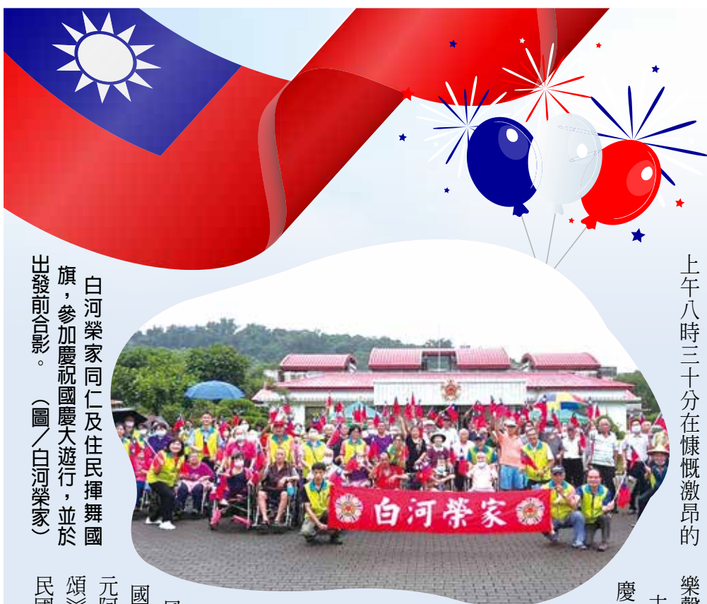
白河榮家同仁及住民揮舞國旗，參加慶祝國慶大遊行，並於出發前合影。

【連線報導】欣逢雙十國慶，會屬機構紛紛舉辦升旗典禮、遊行、愛國歌曲比賽等活動，讓榮民(眷)都能抒發愛國情懷。 升旗典禮 揮國旗 唱國歌 桃園榮家在逸仙廣場舉辦國慶升旗典禮，清晨六時即有長輩戴著國旗口罩、手持小國旗到場；一一〇歲的人瑞、坐著輪椅的長輩也精神抖擻參與，榮家逾百位工作人員及住民長輩齊聚，凝視國旗冉冉升起，接著高唱國歌。九十多歲的單爺爺是雙十壽星，年年到場升旗，興致高昂。