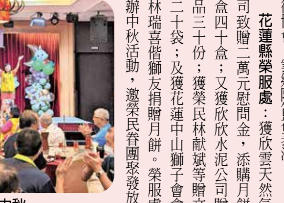
花蓮縣榮服處邀榮民(眷)歡度中秋。