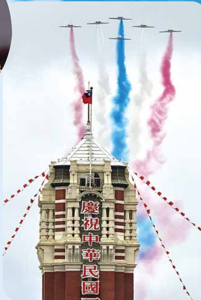
空軍雷虎特技小組A1-3教練機，採六機三角隊形，噴出彩煙，通過總統府上空。