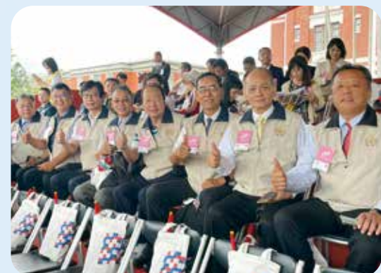
在總統府前觀禮的8位榮民楷模，齊祝中華民國生日快樂。

變遷的兩岸及國際情勢中，政府傾全力發展經濟、厚實國力、照顧人民、確保國家安全、穩定兩岸情勢，並且爭取國際支持。經過全體國人七年多努力打拚，臺灣的經濟展現強大的韌性，更成為驅動全球供應鏈重組的關鍵力量，中華民國的國力變強了！ 十點整，府前廣場響起一年一度最動人的國歌頌唱，由國立馬公高中合唱團四十九位學生，與左營軍港的國艦國造玉山軍艦一〇八位官兵齊唱，並與陸戰隊AAV7兩棲突擊車五輛現場連線，以「V」字隊形，與「舉國同歡」方式呈現官兵勤訓精練形象，並於大會主題視訊牆播放駐地官兵代表共同演唱國歌畫面，展現軍民同胞團結一心的情懷。同時，由陸軍CH47SD運輸直升機吊掛巨幅國旗，由兩架UH-60M黑鷹直升機引導及跟隨，通過總統府前上空，以凌空飄揚的國旗，為國家慶典增添光輝，並鼓舞軍民士氣及凝聚向心力。