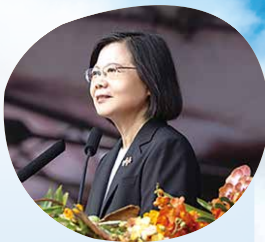
蔡總統以「自信沉穩、國家前進讓世界因臺灣而更好」為題發表演講。

總統在演講中強調自信沉穩的臺灣，一定會繼續前進。「我們不只要給世界更好的臺灣，更要讓世界因為民主臺灣而更好。」 總統國慶演說 展現堅韌自信 總統指出，「潛艦國造」的第一艘原型艦下水了，國防自主再跨出一大步，國軍不對稱戰力再向上提升，展現守護中華民國的決心，這正是中華民國立足臺灣七十四年，之所以屹立不搖的精神。 總統闡述，過去七年多，在劇烈