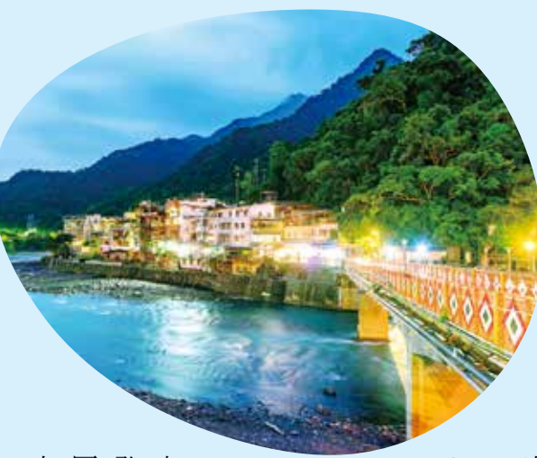
夜間的烏來溫泉區同樣迷人。

▲北投光明路旁的小溪，流淌著青磺泉的泉水。而一百多年來累積的溫泉文化，讓北投溫泉一帶有著豐富歷史景觀，不管是紀念臺灣第一家溫泉旅館的「天狗庵史蹟公園」，或是于右任親筆題字的「梅庭」歷史建築。近幾年遊客喜歡順遊的景點，莫過於「臺北市立圖書館北投分館」，以臺灣首座世界級的綠建築圖書館而聞名，座落在林木茂密、生態環境豐富的北投公園裡，原木建築外觀讓人忍不住想「森」呼吸一下，怎麼拍都好看的景點裡，記得要輕聲細語，保留溫泉鄉誘人的寧靜。