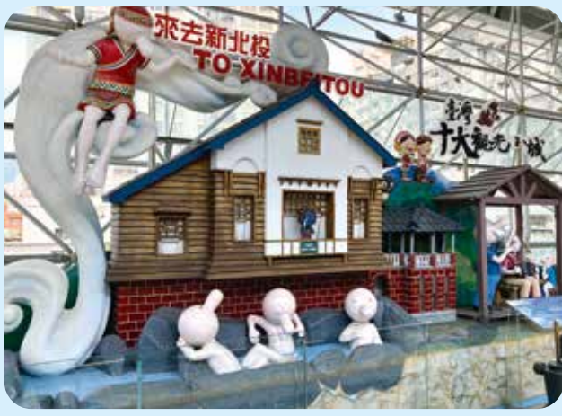
臺北捷運新北投站內轉往新北投支線的月臺，充滿溫泉鄉意象。

距離老街約六分鐘路程的烏來吊橋，緣起日據時代為了供應發電機用水興建攔水壩，曾在烏來發電廠下游建造烏來南勢吊橋。如今舊橋雖已不存，取而代之的是民國九十九年完工的烏來景觀吊橋。橋身橫跨南勢溪，長約一百公尺，遊客站在橋上，可遠眺烏來溪谷風光，盡覽南勢溪與楠後溪匯流之處。