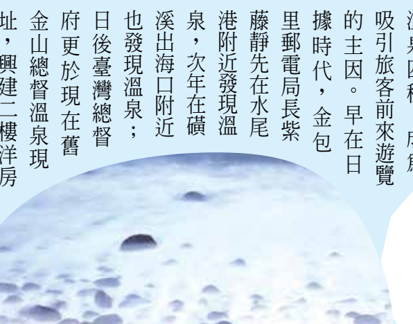
除了泡湯，金山、萬里一帶受到氣候、地形和海浪等因素影響，形成豐富的自然景觀。像是金山區的「神祕海灘」位於地標「燭臺雙嶼」附近，海岸綿延數百公尺，從水尾漁港旁的木棧階梯上來，迎面而來是一望無際的大海和海蝕地形，海水拍打在嶙峋怪石上，可近距離感受海的洶湧和浪花。

金山溫泉通常指位於新北市金山區及萬里區境內的溫泉區，擁有由陽明山大屯火山群延伸而來的火成岩溫泉。金山因位於二百五十萬年前形成的火成岩逆衝斷層上，產生許多源源不絕的溫泉水脈，同時因臨海而擁有海洋砂溫泉、硫磺