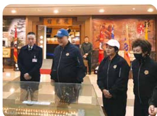
吳副主委（左二）由國防大學校長劉志斌上將（左一）接待，歡喜參觀校史館。

【本刊訊】輔導會一二年度安養機構年終工作會報，十二月二十五日在桃園榮家舉行，由副主委吳志揚代表表主任委員主持，他在會中指導各榮家加強住民長輩身心的關懷與照顧，尤其是年節前後，需特別掌握住民心情變化，提供最佳的安養照顧環境。 輔導會各處會主管、各榮家主任均出席會報，就養護處提醒各榮家防範意外事件、營造友善職場、強化長者金融教育、宣導機構用火用電安全。高雄榮家主任郭豫臨及中彰榮家主任呂德義，在會中專題報告，分享營造幸福歡樂環境心得及榮家評鑑經驗。 另外，吳副主委偕同會人員參訪國防大學，受到校長劉志斌上將熱烈歡迎，劉校長簡報了國防大學的沿革及光榮傳統，並引導參觀校史館。