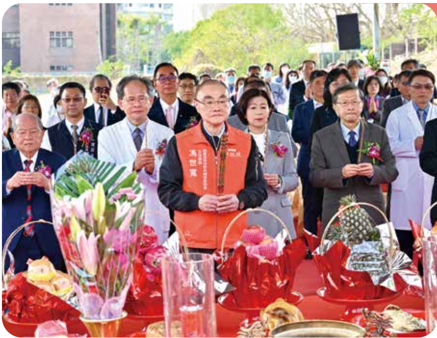
主任委員(前中)偕核安會主委陳東陽(二排右一)、臺中市副市长王育敏(二排右二)、中榮院長陳適安(二排左二)及貴賓,為中榮質子中心開工上香祈福。

【連線報導】會屬榮總傳盛事,包括臺中榮總舉行「質子中心開工大典暨全自動智能檢驗室開幕典禮」,高雄榮總舉行「高榮聯醫 共創卓越」記者會,宣布自今年一月一日起接手高雄市中榮醫院的營運管理。輔導會主任委員馮世寬均出席致詞,盼兩院為國人提供更高水準的醫療服務,及加強服務榮民。 中榮質子中心在本院區,開工典禮於二十二年十一月二十五日舉行,由馮世寬主委、核能安全委員會主委陳東陽、臺中市副市长王育敏及院長陳適安共同主持,並邀請貴賓共同為中榮祈福。 質子治療可提供更好的療效及更精準的治療,降低正常組織輻射劑量及副作用,利於增加癌症控制率和生活品質。中榮選擇日本住友公司的最新型Cybeam超導質子系統,治療速度是傳統設備的三倍。 中榮全自動智能檢驗室在南院區門診大樓後棟三樓,藉由電動車運送檢體,以智能軌道系統連結生化、免疫、血液、血凝及體化血色素檢測流程,每天可檢驗檢體一萬支以上。 另外,「高榮聯醫 共創卓越」記者會於二十二年十二月二十二日在高雄市中榮醫院舉行,宣布高雄市中榮醫院由高榮總營運管理,馮世寬主委、高雄市長陳其邁出席記者會,並與健保署及醫界代表共同進行營運啟動儀式。 市長陳其邁說,感謝馮世寬主委這項決定,聯醫與榮總合作,讓醫療體系從地方社區醫院到醫療中心垂直整合。未來在輔導會支持下,榮總十年內會投入十億元預算,改善聯醫設備,新建第二醫療大樓,提供遠距醫療服務,整體提升服務品質與量能。市民就近到聯醫診療,能獲得醫學中心等級服務。主委馮世寬致詞說,高雄有不少榮民,盼由此得到更好的照顧。 主委視導北榮桃園分院 關懷榮民傷兵 主任委員又於行憲紀念日,視導北榮桃園分院的醫療成果與未來規劃,讚許該院積極配合政策,開辦兒童早療聯合評估中心及中醫科,提供民眾整合式的醫療服務。主委也戴上耶誕帽,攜帶禮物,到各病房探視一位榮民傷兵,並在病房題字留言「日日進步,身體健康」,讓榮民傷兵及家屬備感窩心。