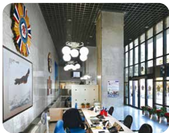
▲輔導會進門大廳挑高又寬廣，十分氣派。