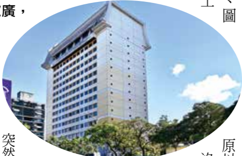
►輔導會辦公大樓外觀高雅，充滿現代感。

突然報導我將另有新職，我卻在沒拿到新職命令前，按計畫完成了心願，如今進大廳再看這這充滿人文氣息的作品，這可是臨去秋波囉！這是靈感、毅力、得多助的結晶啊！