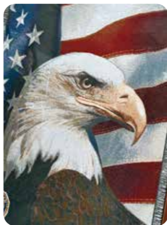
►掛毯中的白頭鷹，造型立體，栩栩如生。

我們退輔會的辦公大樓，坐落在臺北市忠孝東路五段二二二號，外觀獨特，遠看屋頂，會誤認它是一座大廟，近觀外牆黃白相間的樓層配色，顯得高雅又充滿現代感，據聞是藝術家林文昌的創作。 它那挑高寬廣的大廳真夠氣派，那一大片大理石牆面，在民國七〇年代建構時一定所費不貲，但牆面除了正面的退輔會徽外，空無一物，顯得空曠冷清，我很早就想在這宏偉的廳堂添加些人文氣息。 首先是數月前，我即要求把大廳榮民服務臺上的透明屏風拆除，因為我們既非郵局、亦非銀行，上年紀的榮民(眷)要由一個小「洞口」遞拿文件、圖章等實有不便，同時也把洽談的工作平臺重做，降低高度，讓榮民蒞臨這寬敞的空間時，會增進洽談時的親切與友善之感。 接著我發現我們的替代役同