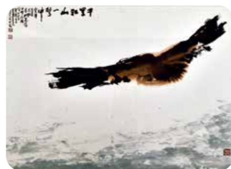
►李奇茂大師的「千里江山一擊中」畫作，畫中的老鷹迅猛非凡，神氣活現。

仁人才濟濟，我即請有室內設計及藝術專才的這些年輕博士來研議，如何把那一「冷」的高牆予以活化？讓我們的大廳一看就充滿了朝氣！ 我們先請《榮光雙周刊》的資深攝影林大哥，專程去臺東志航基地，翻拍李奇