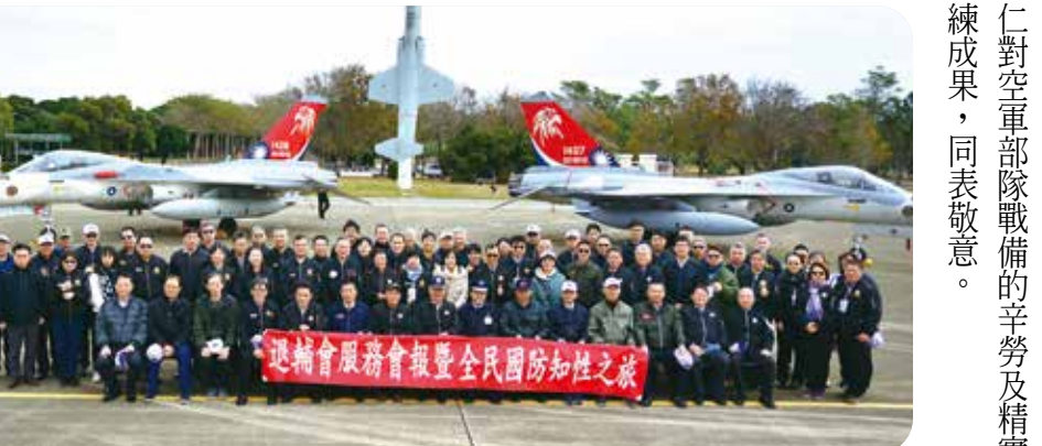
李副主委（前中）偕服務會報與會人員參訪空軍清泉崗基地，在經國號戰機前合影，並向空軍官兵致敬。

【本刊訊】輔導會一月二十三日舉行「一二年服務機構年終工作會報」，由副主任委員李文忠主持，他致詞感謝榮服處第一線服務人員對榮民（眷）的辛勞付出，期許積極結合榮家、榮院及地方府、民間團體的社福資源，建構一張綿密的照護網絡，一起為提升榮民（眷）的服務照顧品質而努力。 李副主委期勉各級服務人員藉由平常訪視時機，發掘有需求的榮民（眷），並表示，最近天氣較不穩定，早晚溫差大，而且新冠病毒肺炎和流感的疫情又持續升溫，請同仁對於特需、較需或是高齡的榮民（眷）要特別留心，務必常常關心他們，並且提醒他們要照顧好自己。 會報在臺中市的中興路太教育園區舉行，各處會主管、