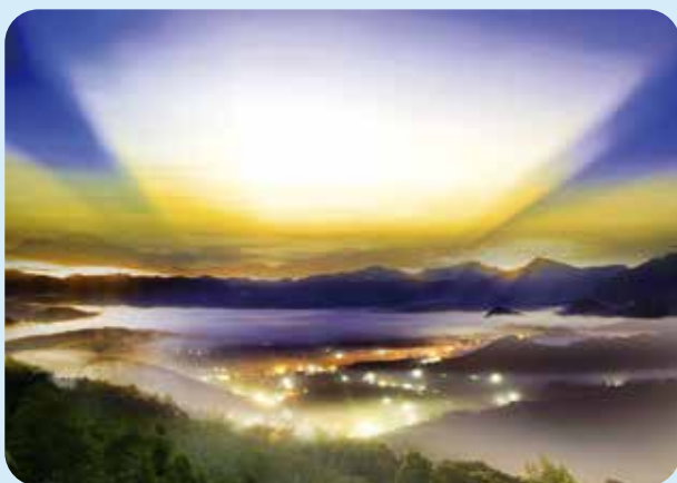
金龍山日出最特別的是琉璃光景。南投縣魚池鄉早在史前時期就有人類活動。日據時代，曾有日本考古學者在神社等地採集到打製石器及磨製石器數件，民國四十四年，臺灣大學及南投縣文獻委員會的考古組在光華島、水社、文武廟等地潭邊，採集石器與陶器數千件。漢人最早開拓南投縣的紀錄是明鄭時期，清康熙年間出版的補纂《臺灣府志》中提到「水沙連社麻丹社」，就是指位於今天日月潭畔水社的原住民部落。而早在清康熙、乾隆年間，水社出產的茶葉已頗為出名，嘉慶年間，漢人大量入墾，到日據時期之後，魚池鄉的

會穩定具重大意義。民國一十一年開幕的「臺灣客家茶文化馆」，為國家級重要產業文化場館，是浪漫臺三線的重要樞紐。在茶產業發展方面，以「茶文化展示」與「茶產業體驗」為主軸，並以客家文化作為發展重心，將臺三線的地理環境優勢及人文產業發展加以整合。像是文化館中頗具特色的「天光大廳」，「天光」在客家話裡既可表達清晨曙光，也是明日希望之意，象徵著不管農務或載貨啟行，在黎明之際，浮現對時空美感與浪漫心境的轉化。種種細膩安排，讓「臺灣客家茶文化馆」成為體會精緻客家文化的好所在。