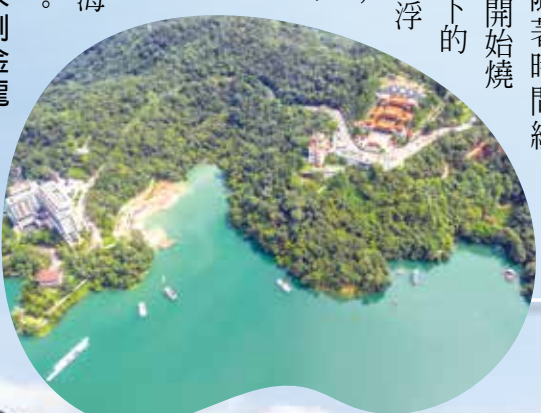
紅茶成為遠近馳名的特產。位於魚池的金龍山，是臺灣觀賞日出的三大勝景之一，尤其因為高度僅八百公尺左右，相較於高山，容易抵達，還擁有雲海及日出的珍貴高海拔地區景色，是臺灣中部迎接曙光的熱門勝地。夜晚透過雲隙，經常能映射出山下如星火的點點燈光，時而透紅，時而染橘，隨著時間經過，烏黑的雲開始燒得火紅，山腳下的琉璃光在雲層浮動間飄動著，這麼特殊的景色，不僅是喜愛拍照的人不會錯過的景點，更是許多人心中雲海勝景的第一名。

會穩定具重大意義。民國一十一年開幕的「臺灣客家茶文化馆」，為國家級重要產業文化場館，是浪漫臺三線的重要樞紐。在茶產業發展方面，以「茶文化展示」與「茶產業體驗」為主軸，並以客家文化作為發展重心，將臺三線的地理環境優勢及人文產業發展加以整合。像是文化館中頗具特色的「天光大廳」，「天光」在客家話裡既可表達清晨曙光，也是明日希望之意，象徵著不管農務或載貨啟行，在黎明之際，浮現對時空美感與浪漫心境的轉化。種種細膩安排，讓「臺灣客家茶文化馆」成為體會精緻客家文化的好所在。