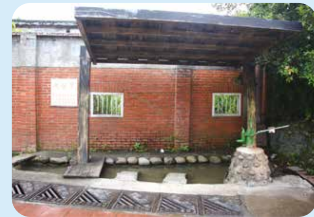
三坑老街上的黑白洗，顯示早年客家人的生活樣貌。

沙止在清朝臺灣方志中記載為「水返腳」，《淡水廳志》寫著：「水返腳，謂潮漲至此地。」清咸豐之後淡水開港，淡水至大稻埕之間的船隻往來頻繁，商人沿淡水河而上收購茶葉；沙止位於淡水河支流基隆河中段，到了日據時代，與沙止相關的渡口就有十二個，連通基隆與臺北之間，沙止也因交通便利，繁華一時。