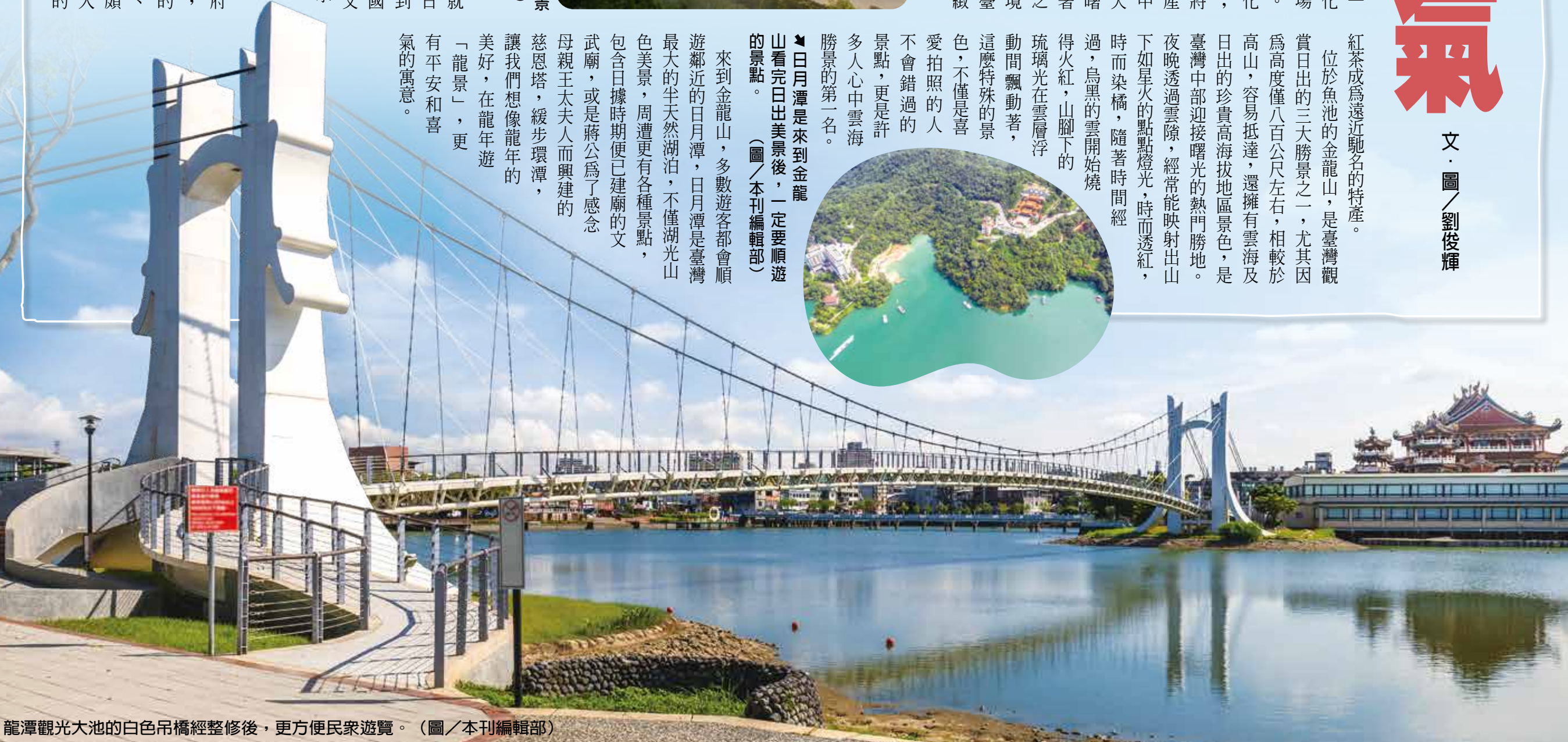
龍潭觀光大池的白色吊橋經整修後，更方便民衆遊覽。

來到金龍山，多數遊客都會順遊鄰近的日月潭，日月潭是臺灣最大的天然湖泊，不僅湖光山色美景，周遭更有各種景點，包含日據時期便已建廟的文武廟，或是蔣公為了感念母親王太夫人而興建的慈恩塔，緩步環潭，讓我們想像龍年的美好，在龍年遊「龍景」，更有平安和喜氣的寓意。