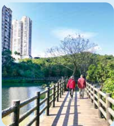
沙止金龍湖位於市區，是附近居民散步休閒的場所。

沙止金龍湖位於市區，是附近居民散步休閒的場所。位於新北市沙止區的金龍湖，是大臺北地區知名湖泊。金龍湖早期是農田灌溉用的陂塘，相較於天然形成的湖泊常位於郊區或深山之中，金龍湖交通便利，