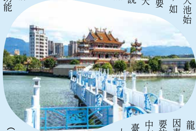
龍潭觀光大池，和許多陂塘一樣，早年主要功能「龍潭觀光大池」和許多陂塘一樣，早年主要功能

桃園市龍潭區舊稱「菱潭陂」，後稱「靈潭陂」、「龍潭陂」，地名則由龍潭大池而來，據說當年大池水面遍布野菱，即使歷經多次旱季，大池始終保持一定水量，如果久旱不雨，只要在池畔祈雨即可天降甘霖；後因傳說在某日風雨交加夜間，發現池中有一黃龍出沒，因此改名為「龍潭陂」，龍潭之名便延續至今。