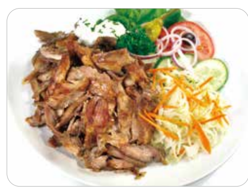
▲鹹豬肉又鹹又香。