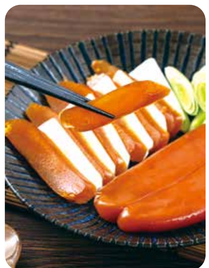
▲烏魚子十分鮮美。 (圖/本刊編輯部)