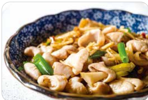
▲薑絲肥腸酸甜甜口。

今年是由老岳母最小、也是最孝順的女兒及女婿主持，他們特別選了臺北市吉林路上一家知名的客家餐廳，讓大家換換口味，享受一下客家美食。席中菜餚可口不在話下，當日因餐廳客人眾多，老闆上了一盤「薑絲肥腸」，有夠酸甜爽口，正當大家大快朵頤時，老闆來告訴我們：「上錯菜了，這是別桌點的。」但是看到我們照樣給你們。」他真會做生意，難怪這家餐廳客人滿滿。